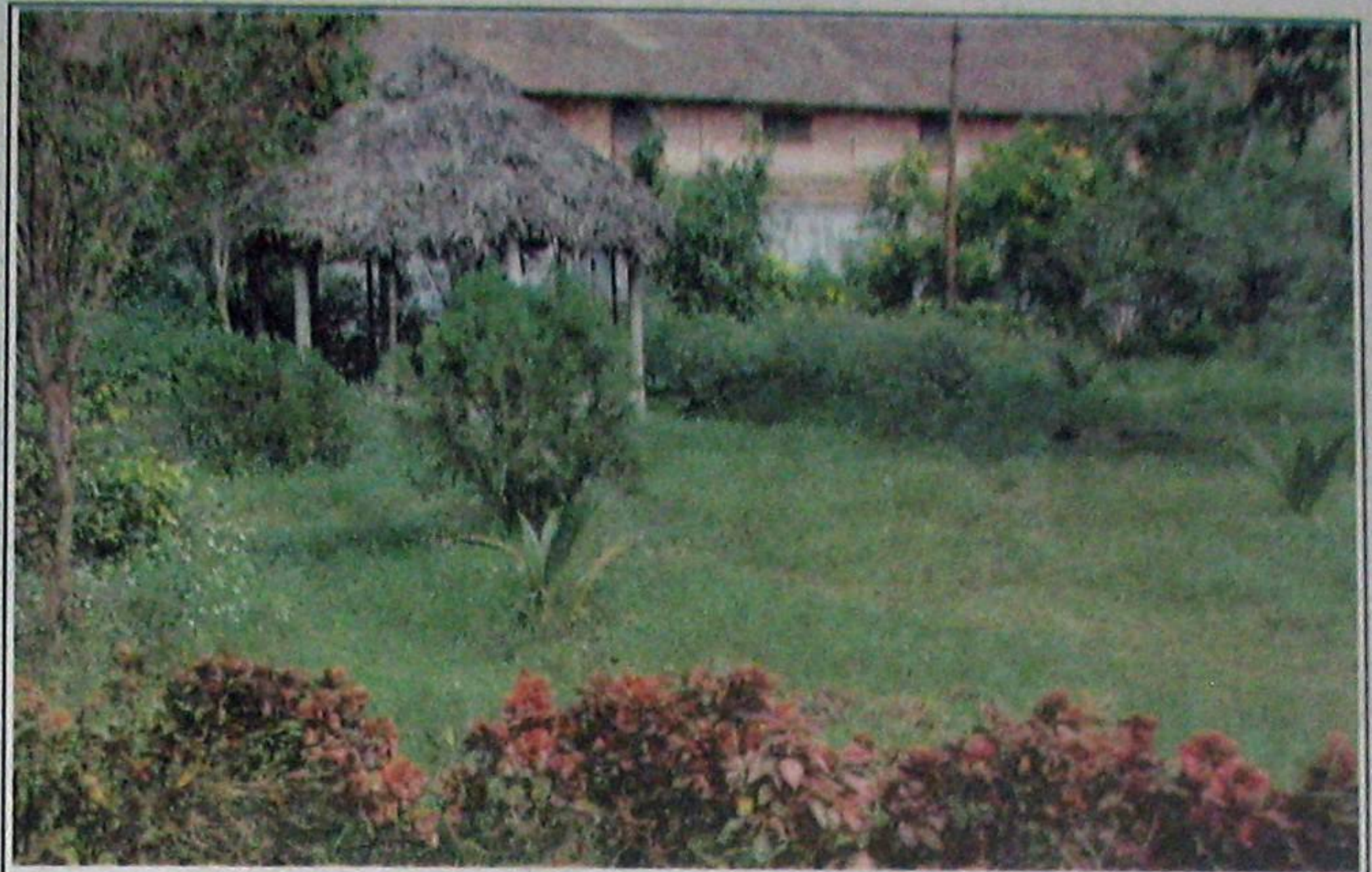
స్వతంత్ర పార్కులో చీకటి కార్యకలాపాలకు అనువుగా చెట్ల గుబురు.

నగరం నడిబొడ్డులో వుండే స్వతంత్ర పార్కు చీకటి కార్యకలాపాలకు నిలయంగా మారింది. మిగతా పార్కులు అలాపాలనా లేక పాడుబడిపోయి వున్న సమయంలోనూ ఈ పార్కు మాత్రం నిత్యం జనంతో కిటకిటలాడు తుండేది. ఇటీవల ఈ పార్కును అభివృద్ధి పరచడంతోపాటు ఇక్కడ ఒక సమ్మర్ స్టోరేజి ట్యాంకును నిర్మిస్తున్నారు. రాజకీయ చైతన్యంకల్గినవారు, రకరకాల అంశాలపై డిల్లీ నుంచి గల్లీ దాకా మాట్లాడకలిగే వారంతా సాయంత్రమైతే