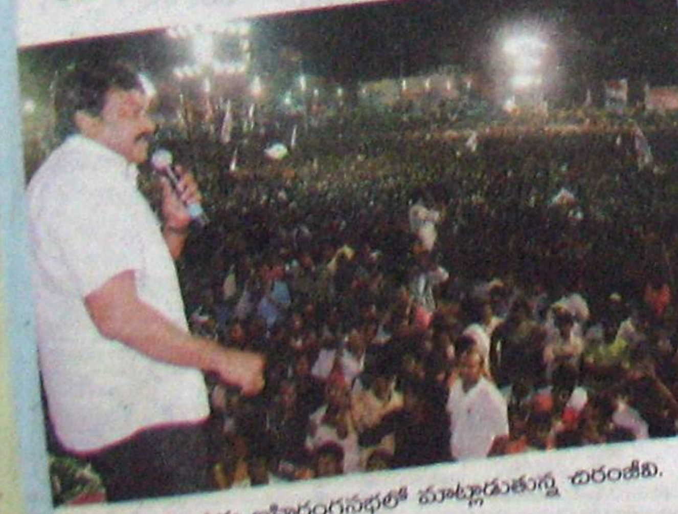
నెల్లూరు బహిరంగసభలో మాట్లాడుతున్న చిరంజీవి.