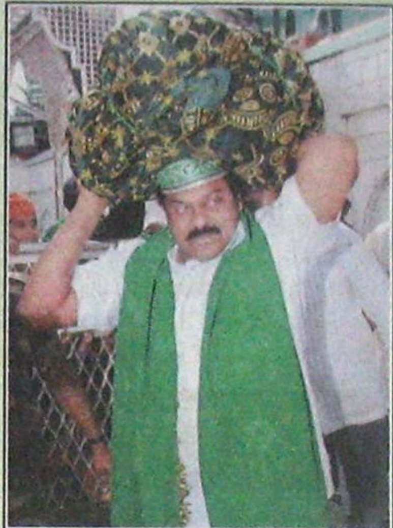
కసుమూరు మస్తానయ్య దర్గాలో చాదరీతో చిరంజీవి.

చేయిస్తుంది. రాజకీయాలు ఒకరి గుత్త సొత్తు కాదు. ఎవరితో ప్రజలు వుండేది ఈసారి ఎన్నికల్లో తేలిపోతుంది. వారికి ధన, కండ్, రౌడీ బలముంటే చూకు ప్రజాబలముంది. ప్రజారాజ్యం పార్టీ మహిళా పక్షపాతి. మా అమ్మ పుట్టిన జిల్లాలో మహిళల కోసం వందతో వంటింటి సరుకు పథకాన్ని ప్రకటిస్తున్నాను. తెల్లకార్లు కల్గిన వాళ్లకు వంద రూపాయలకు 25 కిలోల బియ్యం, కేజీ కందిపప్పు, కేజీ నూనె, అరకిలో చింత పండు, కిలో ఉప్పు ప్రజారాజ్యం అధికారంలోకి రాగానే ఇస్తాం. దీనితో ప్రజల ఆకలి సమస్య తీరుతుందని చిరంజీవి ప్రకటించారు. అమ్మ పుట్టిన గడ్డ మీద చెబుతున్నాను. ఇక్కడ రాజకీయం ఒకరి చేతుల్లోనే వుంది. వారు ఎమ్మీటీసీలు, జడ్పీటీసీలు, మేయర్లు ఏ పదవిలో వున్నా మహిళలను ఇబ్బంది పెడుతున్నారు. అది ఇక సాగ