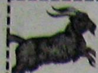
మౌషం (అక్షరం, 5, 6, 7, 8, 9, 10, 11, 12, 13, 14, 15, 16, 17, 18, 19, 20, 21, 22, 23, 24, 25, 26, 27, 28, 29, 30, 31, 32, 33, 34, 35, 36, 37, 38, 39, 40, 41, 42, 43, 44, 45, 46, 47, 48, 49, 50, 51, 52, 53, 54, 55, 56, 57, 58, 59, 60, 61, 62, 63, 64, 65, 66, 67, 68, 69, 70, 71, 72, 73, 74, 75, 76, 77, 78, 79, 80, 81, 82, 83, 84, 85, 86, 87, 88, 89, 90, 91, 92, 93, 94, 95, 96, 97, 98, 99, 100)

ఈవారంలో ప్రతి అడుగు జాగ్రత్తగా వేయాలి. అద్ద, అటంకాలు అధికం. ఓర్పు, సమయోచిత బుద్ధి అవసరం. తీర్ణ కోక సంబంధిత బాధలుండవచ్చు. సోదరులతో వాదనలవాదాలకు దిగవద్దు. మాతృసుఖం కొరవడుతుంది. ఇరుగుసొరుగు వారితో అధిక సంప్రదింపులు తగవు. సంతాన మూలక ఖర్చులుంటాయి. గురువునకు, శనిని కొలవడం మంచిది. నూతనోద్యోగా నకాళాలు కొందరికి కలవు. విద్యార్థులకు చదువులో భంగపాటు.