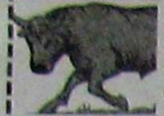
వృషభం (అక్షరం 2, 3, 4, 5, 6, 7, 8, 9, 10, 11, 12, 13, 14, 15, 16, 17, 18, 19, 20, 21, 22, 23, 24, 25, 26, 27, 28, 29, 30, 31, 32, 33, 34, 35, 36, 37, 38, 39, 40, 41, 42, 43, 44, 45, 46, 47, 48, 49, 50, 51, 52, 53, 54, 55, 56, 57, 58, 59, 60, 61, 62, 63, 64, 65, 66, 67, 68, 69, 70, 71, 72, 73, 74, 75, 76, 77, 78, 79, 80, 81, 82, 83, 84, 85, 86, 87, 88, 89, 90, 91, 92, 93, 94, 95, 96, 97, 98, 99, 100)

ఈవారంలో ప్రతి అడుగు జాగ్రత్తగా వేయాలి. అద్ద, అటంకాలు అధికం. ఓర్పు, సమయోచిత బుద్ధి అవసరం. తీర్ణ కోక సంబంధిత బాధలుండవచ్చు. సోదరులతో వాదనలవాదాలకు దిగవద్దు. మాతృసుఖం కొరవడుతుంది. ఇరుగుసొరుగు వారితో అధిక సంప్రదింపులు తగవు. సంతాన మూలక ఖర్చులుంటాయి. గురువునకు, శనిని కొలవడం మంచిది. నూతనోద్యోగా నకాళాలు కొందరికి కలవు. విద్యార్థులకు చదువులో భంగపాటు.