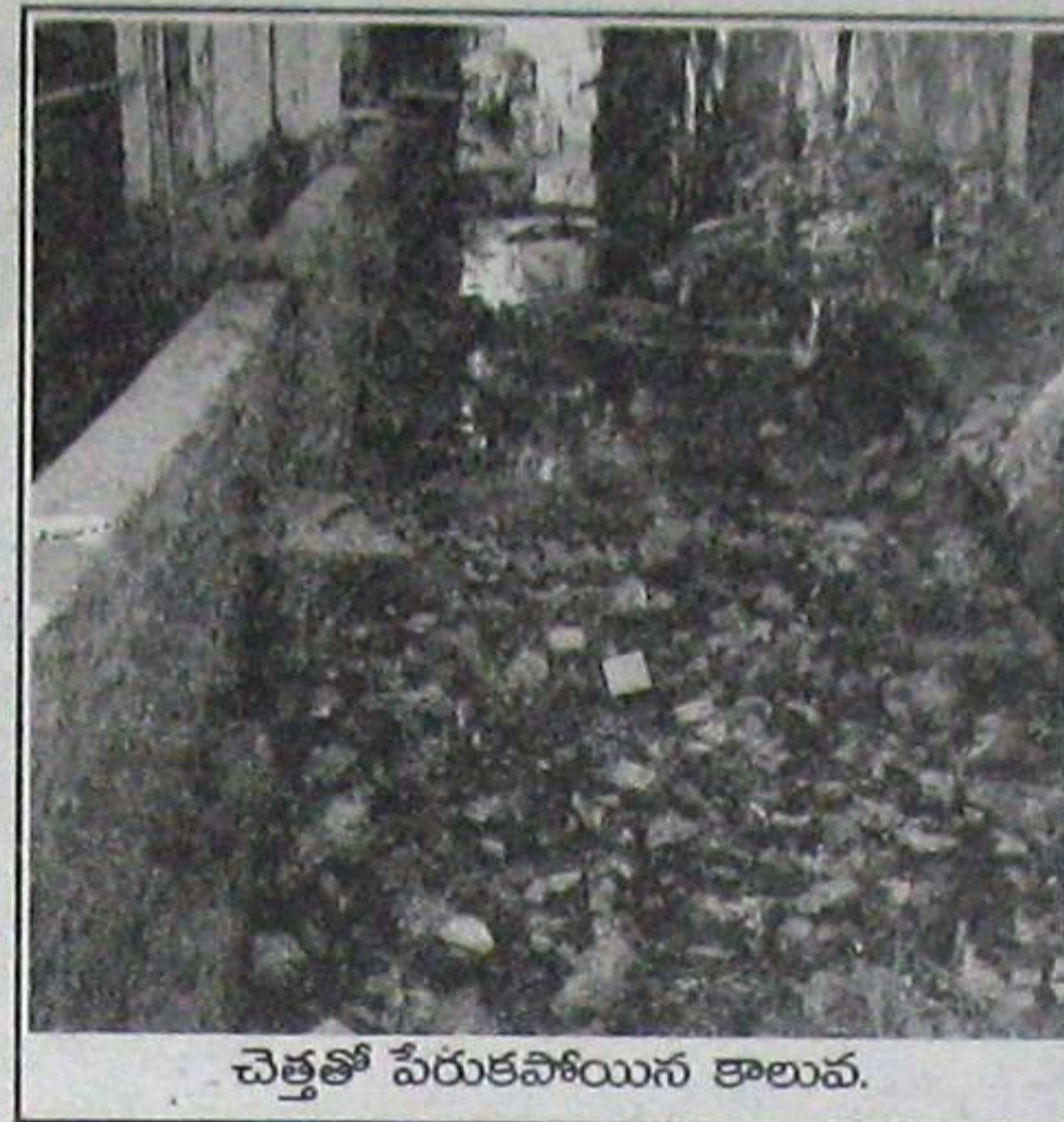
చెత్తతో పేరుకపోయిన కాలువ.

వూర్తిగా వైఫల్యం చెందుతున్నారు. మునిసిపల్ కార్పొరేషన్ అంటేనే ప్రజలు అసహించుకొంటున్నారు.