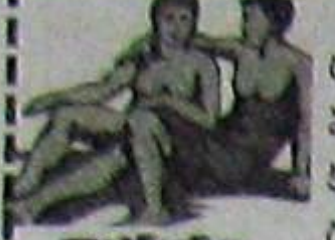
మృగశిరం (అక్షరం 3, 4, 5, 6, 7, 8, 9, 10, 11, 12, 13, 14, 15, 16, 17, 18, 19, 20, 21, 22, 23, 24, 25, 26, 27, 28, 29, 30, 31, 32, 33, 34, 35, 36, 37, 38, 39, 40, 41, 42, 43, 44, 45, 46, 47, 48, 49, 50, 51, 52, 53, 54, 55, 56, 57, 58, 59, 60, 61, 62, 63, 64, 65, 66, 67, 68, 69, 70, 71, 72, 73, 74, 75, 76, 77, 78, 79, 80, 81, 82, 83, 84, 85, 86, 87, 88, 89, 90, 91, 92, 93, 94, 95, 96, 97, 98, 99, 100)

విద్యార్థులకిరాలు జాగ్రత్తగా వాడాలి. కుటుంబంలో కల తలు, చిన్న చిన్న సమస్యలు ఎదురవవచ్చు. దూర ప్రయాణాలు లాభకరంగా ముగుస్తాయి. ధనాదాయ విషయంలో ఎలాంటి లోపం వుండదు. సంతాన అవసరాలను తీరుస్తారు. వారారం భంలో కొంత శ్రమ అనిపించినా తర్వాత హాయిగా గడుస్తుంది. వ్యాపారులు నూతన అవకాశాల్ని చక్కగా వాడుకొంటారు. రాజ కీయులకు, వృత్తివరులకు మంచి సమయం.