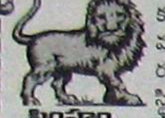
సింహం (అక్షరం 5, 6, 7, 8, 9, 10, 11, 12, 13, 14, 15, 16, 17, 18, 19, 20, 21, 22, 23, 24, 25, 26, 27, 28, 29, 30, 31, 32, 33, 34, 35, 36, 37, 38, 39, 40, 41, 42, 43, 44, 45, 46, 47, 48, 49, 50, 51, 52, 53, 54, 55, 56, 57, 58, 59, 60, 61, 62, 63, 64, 65, 66, 67, 68, 69, 70, 71, 72, 73, 74, 75, 76, 77, 78, 79, 80, 81, 82, 83, 84, 85, 86, 87, 88, 89, 90, 91, 92, 93, 94, 95, 96, 97, 98, 99, 100)

ప్రతి పని చక్కగా ఆలోచించి నిర్వహిస్తారు. ఇతరుల కోసం ఆడంబరంగా ఖర్చు పెడతారు. శుభకార్య నిర్వహణ చక్కగా వుంటుంది. ఖర్చుకు తగిన రీతిలో ఆదాయం వుంటుంది. సోదరులు సమర్థవంతంగా తోడునిస్తారు. ముఖ్యమైన విలువైన వస్తువులు పోగొట్టుకొనే అవకాశాలున్నాయి. ఇరుగు సొరుగు వారితో కిమలాట వుండవచ్చు. దైవదర్శనాల్లో విశేషంగా మనసుపోనిస్తారు. కళాకారులకు కొంత మేలు.