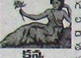
కన్య (అక్షరం 2, 3, 4, 5, 6, 7, 8, 9, 10, 11, 12, 13, 14, 15, 16, 17, 18, 19, 20, 21, 22, 23, 24, 25, 26, 27, 28, 29, 30, 31, 32, 33, 34, 35, 36, 37, 38, 39, 40, 41, 42, 43, 44, 45, 46, 47, 48, 49, 50, 51, 52, 53, 54, 55, 56, 57, 58, 59, 60, 61, 62, 63, 64, 65, 66, 67, 68, 69, 70, 71, 72, 73, 74, 75, 76, 77, 78, 79, 80, 81, 82, 83, 84, 85, 86, 87, 88, 89, 90, 91, 92, 93, 94, 95, 96, 97, 98, 99, 100)

మిత్రుల నుండి సాయం బాగా లభిస్తుంది. సంతాన మూలకంగా సుఖశాంతులున్నా సంతానానికి అనారోగ్యం. శ్రమ వుండవచ్చు. ఇళ్ళు, భూమి, కొనడం అమ్మడం జరుగుతుంది. గతవారం కన్నా ఆరోగ్యరీత్యా బాగుంటుంది. తల్లిదండ్రుల ఆరోగ్య పరిస్థితి అంత బాగుండకపోవచ్చు. వ్యాపారులు హఠాత్పరాజికలను చేపట్టి వ్యాపార నిర్వహణ చేస్తారు. పోటీలను ఎదుర్కొంటారు. విద్యార్థులకు చదువు మందంగా సాగుతుంది.