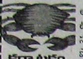
కర్కటకం (అక్షరం 4, 5, 6, 7, 8, 9, 10, 11, 12, 13, 14, 15, 16, 17, 18, 19, 20, 21, 22, 23, 24, 25, 26, 27, 28, 29, 30, 31, 32, 33, 34, 35, 36, 37, 38, 39, 40, 41, 42, 43, 44, 45, 46, 47, 48, 49, 50, 51, 52, 53, 54, 55, 56, 57, 58, 59, 60, 61, 62, 63, 64, 65, 66, 67, 68, 69, 70, 71, 72, 73, 74, 75, 76, 77, 78, 79, 80, 81, 82, 83, 84, 85, 86, 87, 88, 89, 90, 91, 92, 93, 94, 95, 96, 97, 98, 99, 100)

కళిత సంబంధాల్లో ఇబ్బందులుంటాయి. వాదనలవాదాలు తగవు. ధనవిషయంలో ఎలాంటి లోటుండదు. వివిధ పరిమాణాల్లో ధనప్రాప్తి. బంధుమిత్రులతో వుంటూ వచ్చిన స్వర్ణలు కనుమరుగవుతాయి. కళిత ఆరోగ్యం ఆందోళన కల్గించవచ్చు. గృహనిర్మాణ కార్యక్రమాలు ఊపందుకొంటాయి. సోదరుల సాయ మందుతుంది. వ్యాపారులు నూతన పథకాలు అమలుపరుస్తారు. రాజకీయులకు మంచిది కాదు.