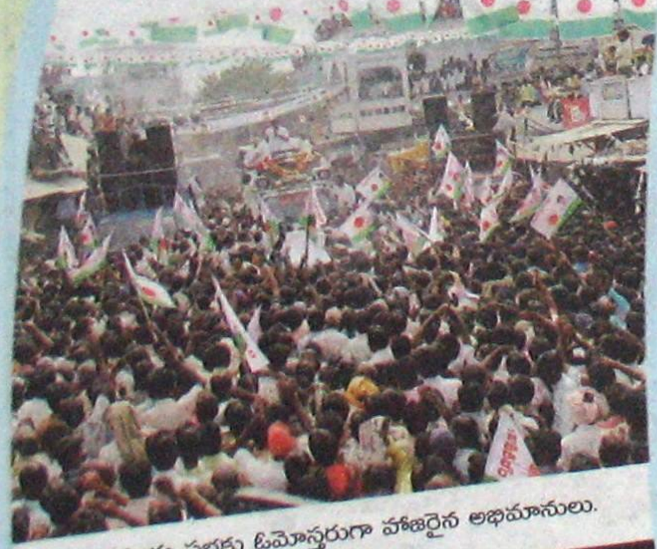
పొదలకూరు సభకు ఓమోస్తరుగా హాజరైన అభిమానులు.

జిందాబాద్ అంటూ పెద్ద పెట్టున నినదించారు. అక్కడ నుంచి చిరంజీవి ప్రజా అంకిత యాత్ర ప్రత్యేక వాహనం జనంలో-కదలడం కష్టమైపోయింది. వేదాయపాళెం మెయిన్ సెంటర్, నిప్పి, కరంట్లపేట, వెంకటరమణ థియేటర్ వద్ద పెద్ద సంఖ్యలో ప్రజలు ఆయన కోసం రోడ్డుపై అడ్డంగా నిలబడిపోయారు. పోలీసులు ఓ పథకం ప్రకారం అంచేద్దర్ భవన్ నుంచి ఆయన్ను పొదలకూరు రోడ్డు వైపుకు మళ్లించారు. మాగుంట సుబ్బరామిరెడ్డి విగ్రహం వద్ద ఆయన రథం వచ్చే సరికి బొల్లినేని సెంటర్లో నిలబడి వున్న జనం పరిగెడుతూ వచ్చి కేరింతలు కొట్టారు. ఫత్తే ఖాన్ పేట సెంటర్లో పెద్దసంఖ్యలో మహిళలు ఆయన కోసం నిలబడి వుండడం కనిపించింది. అక్కన్నవారివీధిలో గతంలో నివసించిన గృహం వైపు చిరంజీవి కొన్ని సెకన్లు దృష్టి సారించారు. ఆర్డీసి బస్టాండ్, మద్రాస్ బస్టాండ్ల నుంచి తొరవ 14వ పేజీలో