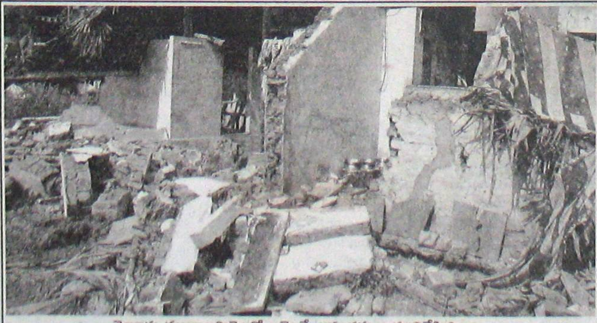
నెల్లూరు ముత్యాలపాళెంలో ఎమ్మెల్యే అనుచరులు కూల్చేసిన ఇల్లు.

బాధితుల సమక్షంలోనే 4వ నగర పోలీసులు నిందితులతో చెట్టాపట్టాలేసుకొని తిరగడం బాధాకరం. బాధితురాలు కొండమ్మ ఇచ్చిన ఫిర్యాదుపై వివిధ సెక్షన్ల క్రింద కేసు నమోదైనప్పటికీ నిందితులను అరెస్టు చేయడంలో మాత్రం వెనుకంజ వేస్తున్నారు. ఎందుకంటే నిందితుల వెనుక నగర ఎమ్మెల్యే వుండడమే కారణంగా చెబుతున్నారు. అదే ఒక సామాన్యురాలి తెలిసి తెలియక నేరం చేస్తే క్షణాల్లో అరెస్టు చేసి రిమాండ్కు మన పోలీసులు వంపుతుండడం అందరికీ తెలిసిందే. పోలీసుల సమక్షంలోనే ఒక పేద మహిళ ఇల్లు అహంకారంతో కూల్చి వేస్తే మాత్రం స్పందించకపోవడం సిగ్గుచేటు. ఒక నివిల్ వివాదానికి సంబంధించి కోర్టులో కేసు నడుస్తున్న సమయంలో ఎవరు కూడా అందులో తలదూర్చరాదని జిల్లా ఎన్ని మల్లారెడ్డి అనేక దఫాలు ప్రకటించి వున్నారు. అయినా కూడా ముత్యాలపాళెంలో ఇల్లు కూలడం అందరికీ తెలిసింది. ఎమ్మెల్యే దౌర్జన్యాల జాబితాలో సామాన్యులు కూడా వుండడం బాధాకరం.