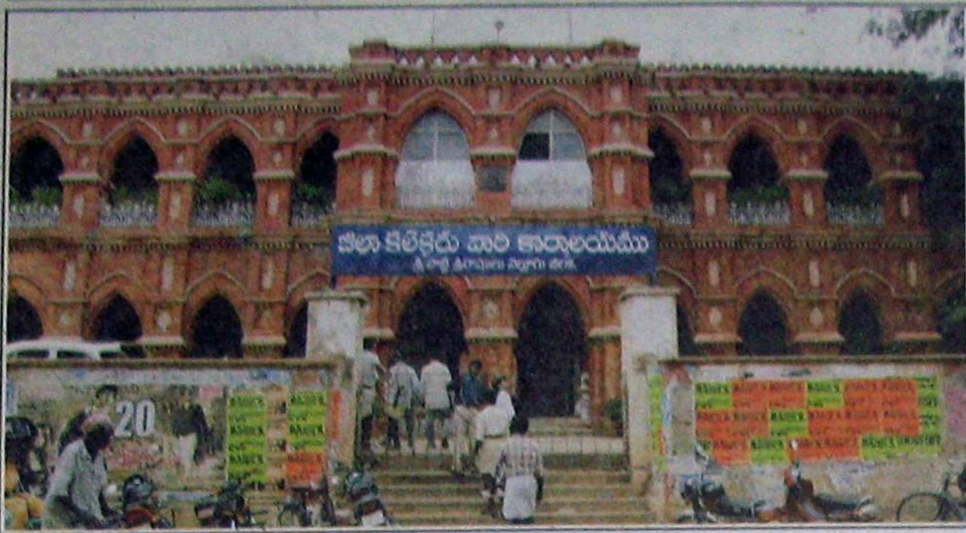
జిల్లా కలెక్టరు వారి కార్యాలయము