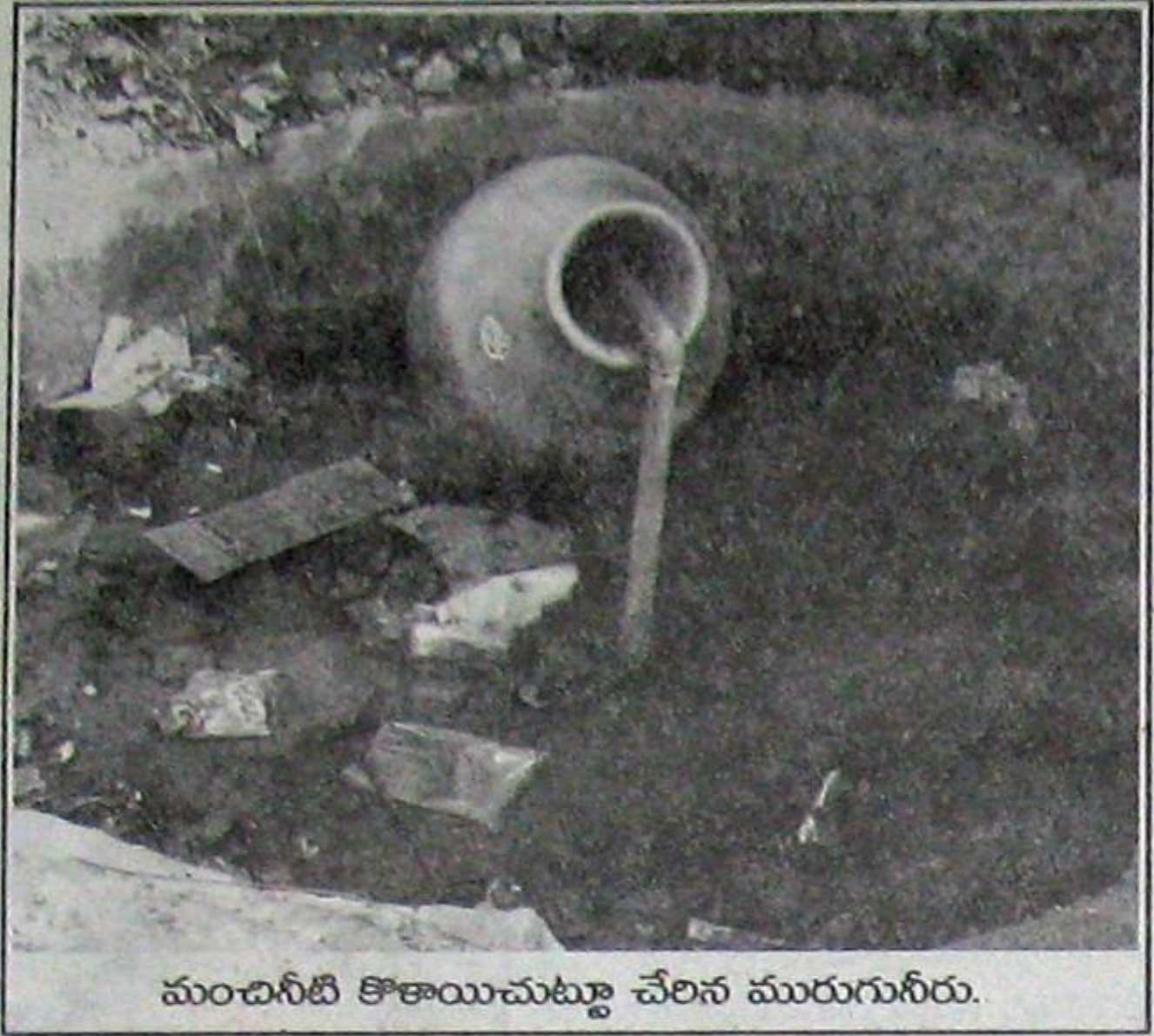
మంచినీటి కొరతను చూపుతూ చేరిన మురుగునీరు.

నెల్లూరు మునిసిపాలిటీ నుంచి కాంప్లెషన్ స్థాయికి ఎదిగి మూడు సంవత్సరాలు పూర్తయినా అభివృద్ధి లో వసూలు చేపట్టడం లేదు. కాల్వ రేటర్లు ప్రతిపాదించిన వసూలు గురించి వట్టింతుకొనే దిక్కు లేకుండా పోయారు.