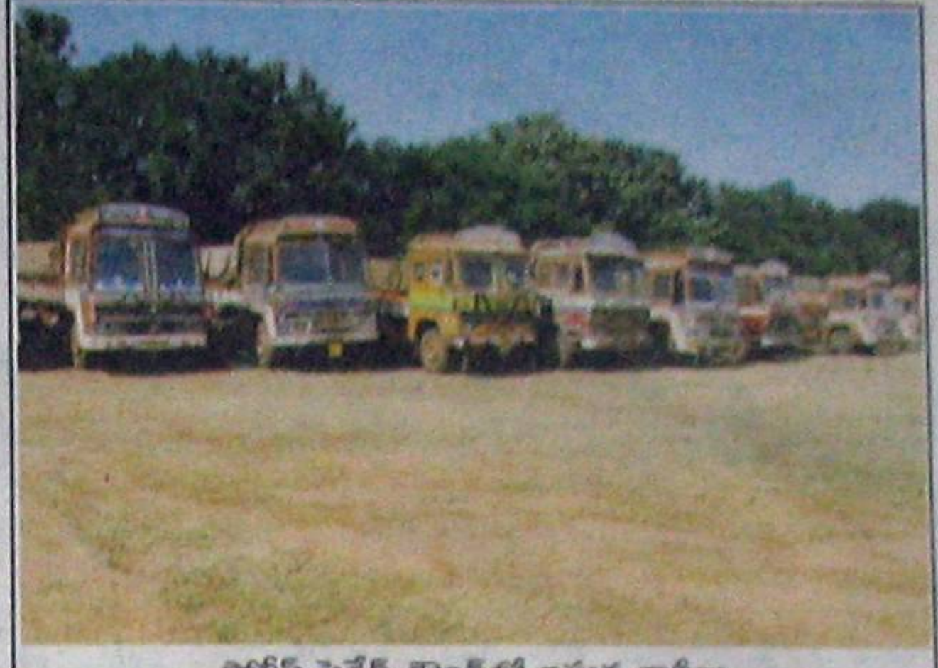
వెట్రీన్ పెరేడ్ గ్రౌండ్లో ఇసుక లాభాలు.

జిల్లాస్థాయి అధికారులైన కలెక్టర్, ఎస్సీలు చిత్తశుద్ధితో పనిచేస్తే ఎటువంటి అవినీతి అక్రమానికైనా అడ్డుకట్ట వేయ గలరు. నెల్లూరు కలెక్టర్, ఎస్సీల బంగ్లాల మీద గత కొన్నాళ్లుగా పొట్టేపాశం, జొన్నవాడ రీవీల నుంచి చెన్నైకు ఇసుక అక్రమ రవాణా అవుతున్న విషయం తెలిసింది. ఈ వ్యవహారంపై ఆసెంబ్లీలో చర్చ జరిగినప్పుడు నాలుగు రోజులు రవాణా, భూగర్భగమల శాఖాధికారులు హంగామా చేసి ఆ తర్వాత పూరుకొన్నారు. ఇసుక స్వర్ణం జాతీయ రహదారి ప్రక్కనుండే మనుబోలు, చిల్లకూరు, నాయుడుపేట, సూళ్లూరుపేట, తడ పోలీస్ స్టేషన్లకు నెలకు 20వేల రూపాయల వంతున మామూళ్లు ఇచ్చి తమ వ్యాపారం జోరుగా సాగిస్తున్నారు. నెల్లూరులోని పోలీస్ స్టేషన్, తన బంగ్లా మీదుగా ఇసుక అక్రమ రవాణా జర