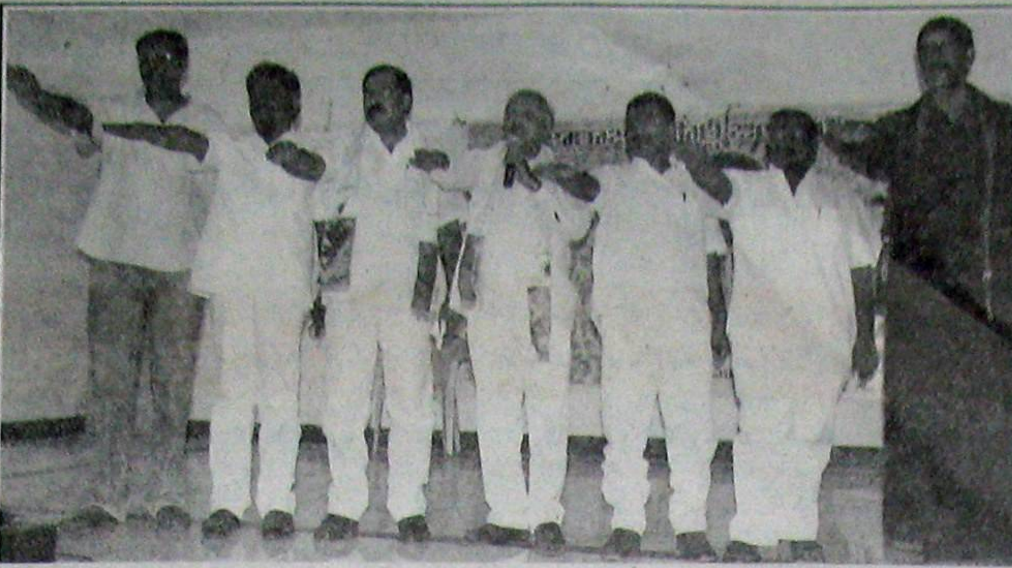
వేదాయపాఠం ఎంజిఆర్ కళ్యాణ మండపంలో జరిగిన ప్రజారాజ్యం పార్టీ మొట్టమొదటి జిల్లా కార్యవర్గ సమావేశంలో ప్రతిజ్ఞ చేస్తున్న ఆ పార్టీ నాయకులు.

ముత్తుకూరు మండలంలో కోడి పందాలు జోరందుకొన్నాయి. లక్షలాది రూపాయలు ఈ పందాలలో కాస్తుండడంతో చుట్టుప్రక్కల ప్రాంతాల నుండి ఇక్కడకు వస్తున్నారని కోడి పందాల రాయుళ్లు. ముత్తుకూరుతోపాటు మండలంలోని పలుప్రాంతాలలో ఈ పందాలు జరుగుతున్నా చోలీసులు వీటిని