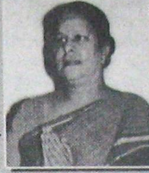
మాగుంట పార్వతమ్మ శాసనసభ్యులు, కావలి