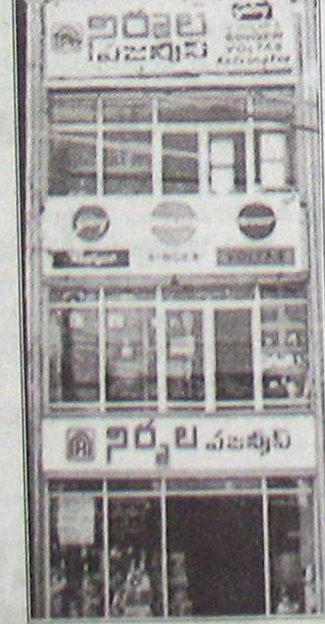
టింకరింగ్కు రావడం అనేది సర్వ సాధారణం. కానీ దానిని అత్యుచితంగానే కొత్త టెక్నాలజీతో మెరుగైన వాడికట్టను చేసి వదిలించుకోవాలి వారంటి ఇస్తున్నారు. ఇలా ఏ

ప్రపంచ ఏడు వింతలు ఎలా ఉన్నాయో అదే విధంగా గోద్రేజ్ రెఫ్రిజిరేటర్లలో ఏడు అద్భుతాలు పొందుపరిచి కొత్త మోడల్స్ను మార్కెట్లో ప్రవేశపెట్టారు. అంతేకాక సముద్ర తీరప్రాంతాల్లో రెఫ్రిజిరేటర్లు తుప్పు పట్టి వాడి