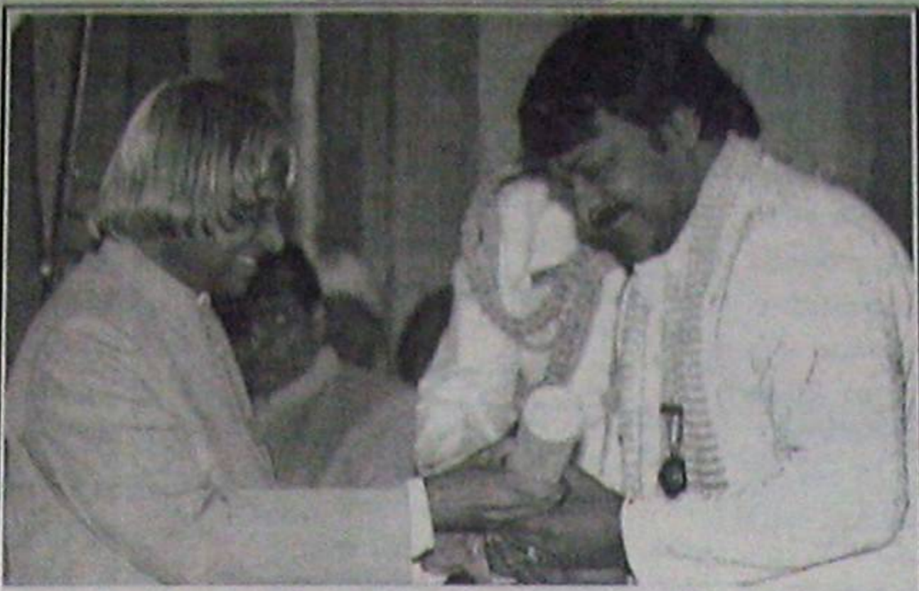
న్యూఢిల్లీలో రాష్ట్రపతి అబ్దుల్ కలాం చేతుల మీదుగా పద్మభూషణ్ అవార్డు అందుకొంటున్న మోగాస్టార్ చరంజీవి

గూర్చి చెప్పినప్పుడు దీన్ని వ్యతిరేకించా. ఆ తర్వాత సన్నివేశానికన్న ప్రాధాన్యతను అర్థం చేసుకుని ఒప్పుకున్నా. చాలామంది ఆ సీను చేయవద్దని నన్ను వారించారు. సిద్ధార్థ్ ఆ సన్నివేశాన్ని చాలా సున్నితంగా తెరకెక్కించాడు. కానీ చాలామందిని ఆ సీను నిర్ణాంత పరచింది. ఈ సినిమా తర్వాత నాకు అలాంటి సీనులున్న సబ్జెక్టులతో కొన్ని ఆఫర్లు వచ్చాయి. అయితే వాటిని మరో ఆలోచన లేకుండా తిరస్కరించా. ఏదైనా సినిమాను చేయాలంటే ఆలోచిస్తా. ముద్దు సీన్లు వున్న సబ్జెక్టులలో నన్ను ఒప్పించడం ఎవరికైనా కష్టమేనంటుంది.