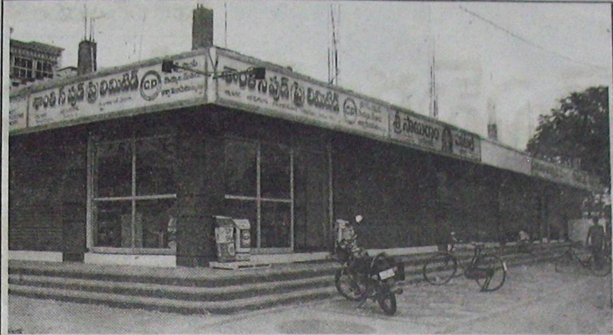
మినీ బైపాస్ రోడ్డులోని ప్రభుత్వ స్థలంలో నిర్మించిన షాపింగ్ కాంప్లెక్స్

దాలు కడితే తమ వుద్యోగాలకు ఎసరు వస్తుందని. ఆ అధికారులు కాళ్లావేళ్లా పడి ప్రాధేయపడినా ఆ కార్పొరేటర్ విన్పించుకోలేదట. పోలీసు కేసు పెట్టి, నిర్మాణం ఆపించడానికి అధికారులు ప్రయత్నిస్తే, ఎమ్మెల్యే వివేకానందరెడ్డి గారి నుంచి ఫోన్ వార్నింగ్ వచ్చిందట. దానితో, కోర్టుకు ఏదో ఒక సమాధానం చెప్పుకోవచ్చు