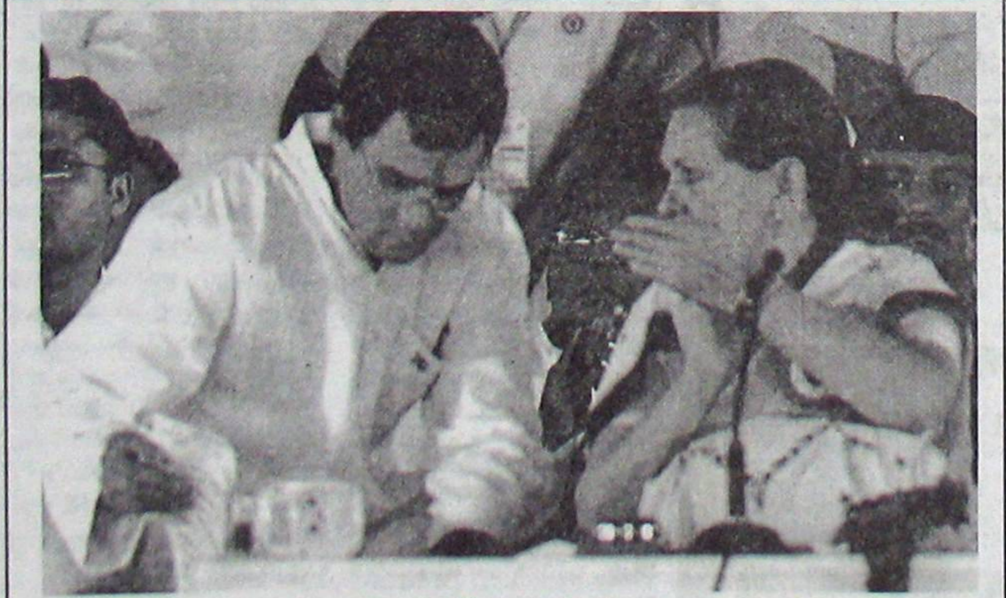
తనయూటికి తల్లి మంత్రోపదేశం

ప్లీనరీ నిర్వహణ విజయం ఘనత మొత్తం ముఖ్యమంత్రి రాజశేఖరరెడ్డి గారికే దక్కిన మాట నిజమే అయినప్పటికీ; అందుకు కారకుడు మాత్రం మాజీ ముఖ్యమంత్రి చంద్రబాబు కావడం ఎవరి దృష్టిని దాటిపోలేదు. చంద్రబాబు టిడిపి నేత కాబట్టి సరిపోయింది కానీ, అదే ఏ కాంగ్రెస్ వాదో అయివుంటే ప్రతి ఒక్కరూ వేదిక మీద నుంచే థ్యాంక్స్ చెప్పి వుండే వారు. అందుకు కారణం ఏమిటో ప్లీనరీకి వాడిన ప్రతివేదిక, ప్రతి భవనమూ చంద్రబాబు కట్టించినవే కావడం. గచ్చిబౌలిలో బాలయోగి పేరిట చంద్రబాబు నిర్మించిన శ్రీదా మైదానం అంతర్జాతీయ స్థాయి నాణ్యతతో కూడుకున్నది. శ్రీదల కోసం అంత ఖర్చు పెడుతున్నారని అప్పట్లో రాజశేఖరరెడ్డి, చంద్రబాబును తిట్టి పోశాడు కూడా. అటులేనప్పుడు ఈ మైదానం ఏమీ చేస్తారు అని ప్రశ్నించారు. కానీ ఇప్పుడు అదే మైదానం అదే రాజశేఖరరెడ్డికి కలిసి వచ్చింది. ఇరవై వేల మంది ప్రతినిధులతో సదస్సు నిర్వహించడం చాలా సులభంగా జరిగిపోయింది. మైదానం నిండా పచ్చటి తివాచీ పరవడం; పందిళ్లు వేయడం తప్ప మరొక కష్టం లేకుండా పోయింది నిర్వాహకులకు. ఈ స్టేడియం ప్రక్కనే చంద్రబాబు ప్రేరణతో నిర్మితమైన ఇంటర్నేషనల్ విజినెస్ సూల్ సిద్ధబ్బుసి సభ్యులు, సీనియర్ కేంద్రమంత్రుల బసకు ఉపకరించింది. లేకుంటే వారికోసం స్టార్ హోటళ్లలో గదులు చూపించలేక ఇబ్బంది పడవలసి వచ్చేది. చంద్రబాబు కోరిక మీదనే ఐవిఆర్‌సిఎల్ కంపెనీ ఆనాడు కట్టిన గేమ్స్ విలేజ్‌లోని ఆధునిక విల్లాలు సోనియా, రాహుల్, మన్మోహన్ సింగ్ ల విడిదికి ఉపకరించాయి. అవి స్టేడియం ప్రక్కనే వుండడం వల్ల వారి రాకపోకలకు భద్రతా ఏర్పాట్ల బాధ తప్పింది. వారిని సీటి కొరవ 12వ పేజీలో