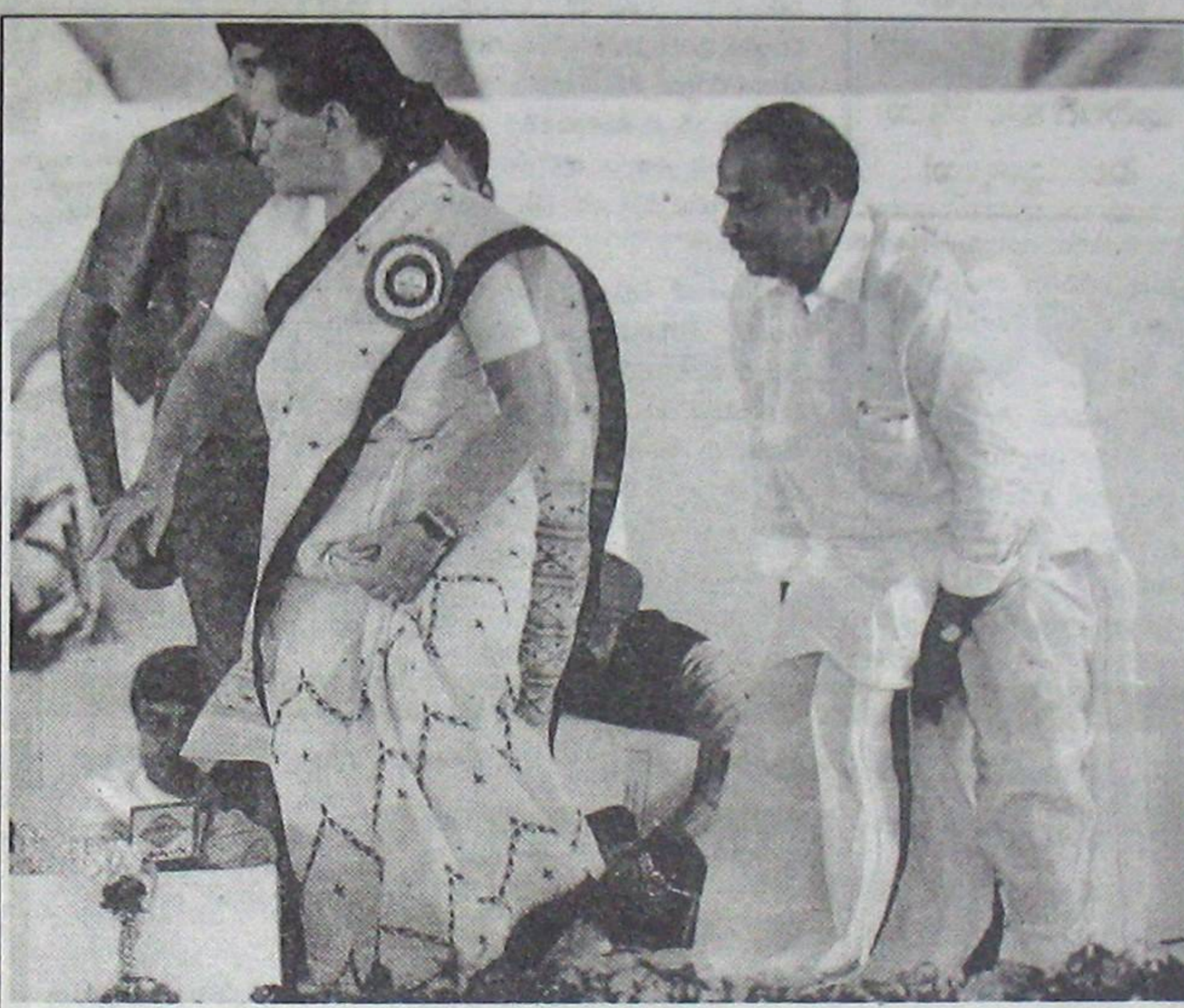
అమ్మా - నీ వెంటే వస్తున్నా!

అది పథకం ప్రకారం జరిగిందో లేక కాంగ్రెస్ వాదులకు అలవాటైన భజన సంస్కృతి వల్ల అనుకోకుండా జరిగిపోయిందో కానీ, ఇటు పార్టీ కార్యకర్తలు, అటు ప్రజలలో కూడా రాహుల్ గాంధీ ప్రతిష్ఠను పెంచడానికి మాత్రమే ఈ ప్లీనరీ ఉపయోగపడింది అన్నది వాస్తవం. సాధారణ ప్లీనరీలో వలె ఇక్కడ ఏ జాతీయ సమస్యపైనా విస్తృత స్థాయి చర్చ జరగలేదు; కాంగ్రెస్ పార్టీ అనుసరించ వలసిన రాజకీయ, ఆర్థిక విధానాల సమీక్ష చేయలేదు; ప్రభుత్వ కార్యక్రమాల తలపోత జరగనే లేదు. జరిగింది సమస్తం - రాహుల్ భజన మాత్రమే. రాహుల్ గాంధీ వస్తే తప్ప కాంగ్రెస్‌కు పూర్వ వైభవం రాదు అని అన్ని స్థాయిల కాంగ్రెస్‌వాదులు ఎలుగెత్తి చాటారు. రాహుల్ గాంధీ రాకుంటే కాంగ్రెస్‌కు భవిష్యత్తే లేదని ఆక్రోశించారు. వీరింతగా ఘోషిస్తున్నా ఆయన మాత్రం పట్టి పట్టనట్లే వుండిపోయారు. వేదిక ఎక్కి నాలుగు మాటలు మాట్లాడడానికి కూడా బెట్టు చేశాడు. చిట్టచివరి రోజు వరకు ఈ నాటకం నడిచింది. అయితే ఆఖరు రోజు ఆయన చేసిన ప్రసంగం మాత్రం కాంగ్రెస్ వాదులకే కాక, సాధారణ పౌరులను కూడా బాగా ఆకట్టుకున్నాడన్నమాట నిజం. ఉత్తరప్రదేశ్ వంటి ముఖ్య రాష్ట్రాలలో కాంగ్రెస్ అంతర్ధానం కావడానికి పార్టీ పోకడే కారణమని కుండ బ్రద్దులు కొట్టినట్లు చెప్పాడు రాహుల్ గాంధీ. ప్రజల కోసం, ప్రజలతో కలిసి పనిచేయనందు