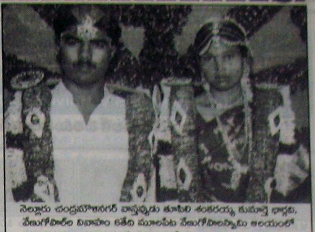
నెల్లూరు చంద్రమోహన్ రెడ్డి వాస్తవ్యుడు తూటెలి శంకరయ్య కుమార్ని ఇచ్చాక, పేనుగోదారాల వివాహం కరతీది మూలపేట పేనుగోదారయ్యను ఇలయంలో ఘనంగా జరిగింది.

4వ పేజీ కొరవ కాల్య లాకుల వద్దకు వెళ్లి ఆగాయి. ఇది జరిగాక మునిసిపల్ పాలకులు కుంభకర్ణ నిద్రవీడి రెండు లక్షలు వెచ్చించి జెసిబి తెప్పించి కట్టల ఎత్తు పెంచారు. పెన్నా బావుల వద్దకు మొదట చేరిన నీళ్లు అక్కడే నిల్వ వుంచి వున్నట్లు యితే బావుల్లో 17అడుగుల నీటి మట్టం వుండేది. ప్రస్తుతం వడదుగులు మాత్రమే వుంది. గట్టిగా కట్టలు వేకాక విలేకయలను చేర్చిన పెన్నానదిలోకి తీసుకొచ్చే చూపెట్టింది. అనకట్ట వద్దకు నీరెక్కుడి