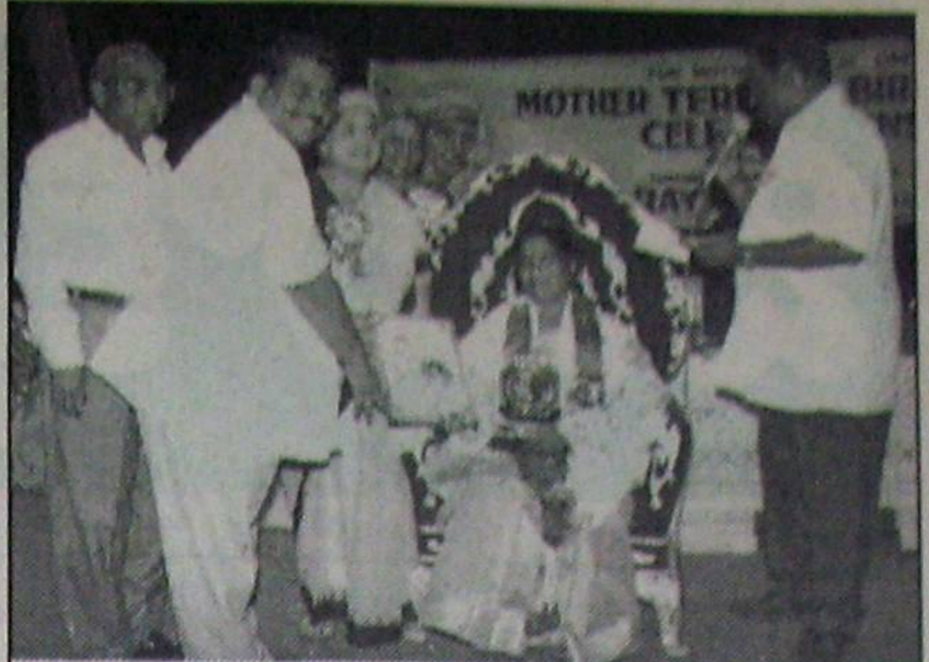
ముద్ర భేరిస్తూ పుట్టిన రోజును పురస్కరించుకొని నిజాం, సాంస్కృతిక కళా రంగాల్లో సేవ చేసినందుకు విజయవాడలోని ఎన్టీఆర్ సంస్కరణ స్థాయి ముద్ర భేరిస్తూ అవార్డును సెల్లారుకు చెందిన శోలి మహిళా ఆర్కైవ్స్ కెసెలెంటు అందిస్తున్న దృశ్యం. ఫిజిలో విజయవాడ దూరదర్శన్ డైరెక్టర్ తిరుపతికి స్వాగతం తెలిపారు.

కృష్ణా నదిలో ఈ ఏడాది కూడా నీళ్లు లేవు. ఇటు ఆంధ్ర అటు మహారాష్ట్రలలో విస్తరించిన కృష్ణా ఆయకట్టు ప్రాంతాలలో వానలు సరిగా కురవక పోవడమే ఇందుకు కారణం. వచ్చిన కొద్ది నీళ్లను కర్షకుల ప్రభుత్వం అల్పబి రిజర్వాయరులో చిగవట్టేసింది. అది వారు ఒక హక్కుగా భావిస్తున్నారు. బచావత్ అవార్డులోని కొన్ని అంశాలలో స్పష్టత లేనందువల్ల వారు ఆడింది అటుగా మారుతున్నది ఒక్కొక్క సీజన్లో నదిలో వచ్చే నీళ్లలో తమ వాటా నికర జలాలు వాడుకున్న తర్వాతనే క్రిందకు