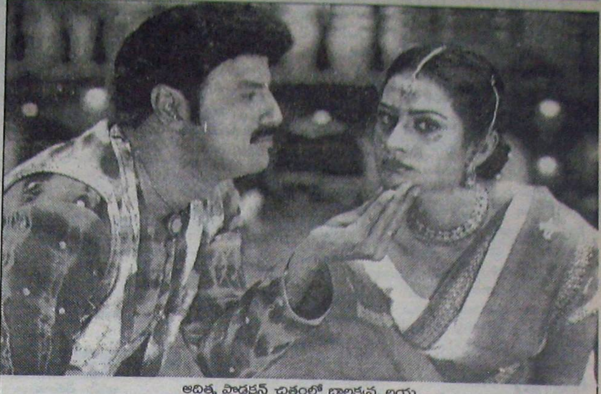
అదిక్క ప్రాడక్షన్స్ చిత్రంలో బాలకృష్ణ, లయ

హీరో నడిపాడట. ఒక అమ్మాయి దక్కన్ క్రానికల్ లో జర్నలిస్ట్ కాగా, మరో అమ్మాయి జోడినెం 1 చిత్రంలో హీరోయిన్ అట. తాను చిరంజీవి అభిమానినని ఉదయ్ కిరణ్ ఆయన కుటుంబానికి దగ్గరయ్యాడు ఉదయ్. నిశ్చితార్థం జరిగాక ప్రియురాళ్లలో ఒకామె ధైర్యంచేసి, అతను వ్రాసిన ఉత్తరాలు, చేసిన బాసలు