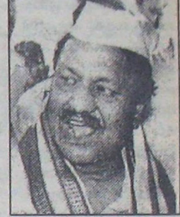
అయితే కాంగ్రెస్ సీనియర్ నేతలందరూ తమ అసంతృప్తిని, ఆగ్రహాన్ని మనసులోనే దాచుకొని గుంభనంగా తిరుగుతున్నారు.

ఒక మునిసిపల్ స్థాయి ఎన్నికలోనే పార్టీ నిబద్ధత, వ్యక్తిగత నిజాయితీ చూపలేని వ్యక్తి మొత్తం రాష్ట్రంలో పార్టీని ఏ గతి పట్టిస్తాడన్నది అందరి ప్రశ్న. రేపటి ఎన్నికల్లో ఇటువంటి చపకబారు తనానికి పాల్పడితే పార్టీ ఏమైపోతుందోనన్నది అందరి ఆందోళన. ఇటువంటి అలవాట్లు కల్గిన వ్యక్తులు పార్టీ నిధుల పంపకం లోనూ ఎంతమేర నిజాయితీగా వ్యవహరిస్తారో పూహించుకోవచ్చు.