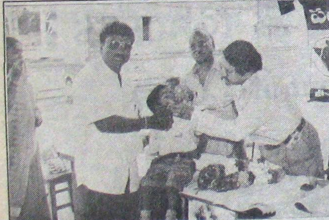
రైల్వే యూజర్స్ అసోసియేషన్ ఫ్లోహోల్స్ ఏర్పాటు చేసిన పర్లమెంటరీ కేంద్రంలో చుక్కలుపెట్టుకుంటున్న మహిళాసాచీకంపెనీ అధినేత ఇన్స్పెక్టర్, ప్రెక్టర్ బాబు వున్నారని.

ఏ విధంగానూ నిర్మాణంలో ఈశాన్యం పెరగకూడదు. ప్రాజెక్షన్లో 'ఫ్లోహోల్స్' పెట్టినా అది వాస్తును అతిక్రమించడమే!