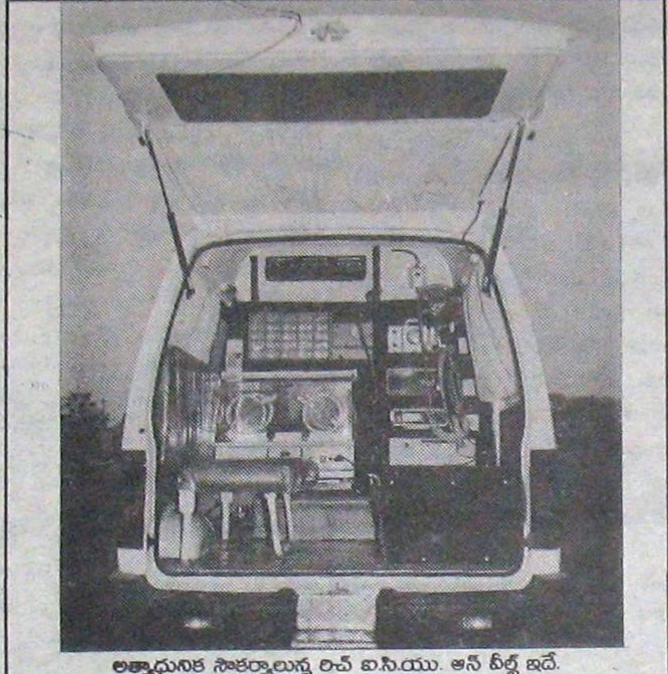
అత్యాధునిక సౌకర్యాలన్నీ రవి ఐసి.యు. ఆన్ టీల్ట్ ఇదే.

ఇంటెన్సివ్ కేర్ యూనిట్ స్థాపించారు. కృత్రిమ శ్వాస కోసం వెంటిలేటర్స్ వున్నాయి. పిల్లల శరీరంలో కల్గే వివిధ మార్పులను ఏ క్షణానికీ ఆ క్షణం పసిగట్టి, డిజిటల్ ఇమేజర్స్ రూపంలో ప్రదర్శించి, డాక్టర్లకు రోగి పరిస్థితిపై పూర్తి అవగాహన కల్పించే డిజిటల్ మానిటర్లున్నాయి. అల్ట్రా సోన్ గ్రాఫ్, ఇజి, ఇసిజి వంటి పరీక్షలన్నీ ఒకేసారి జరిపి, సమయం పొదుపు చేసి, వెనువెంటనే చికిత్స మొదలు పెట్టడం కోసం ఇంటర్మోడియరీ మెడికల్ కేర్ యూనిట్ ప్రతిష్ఠించారు.