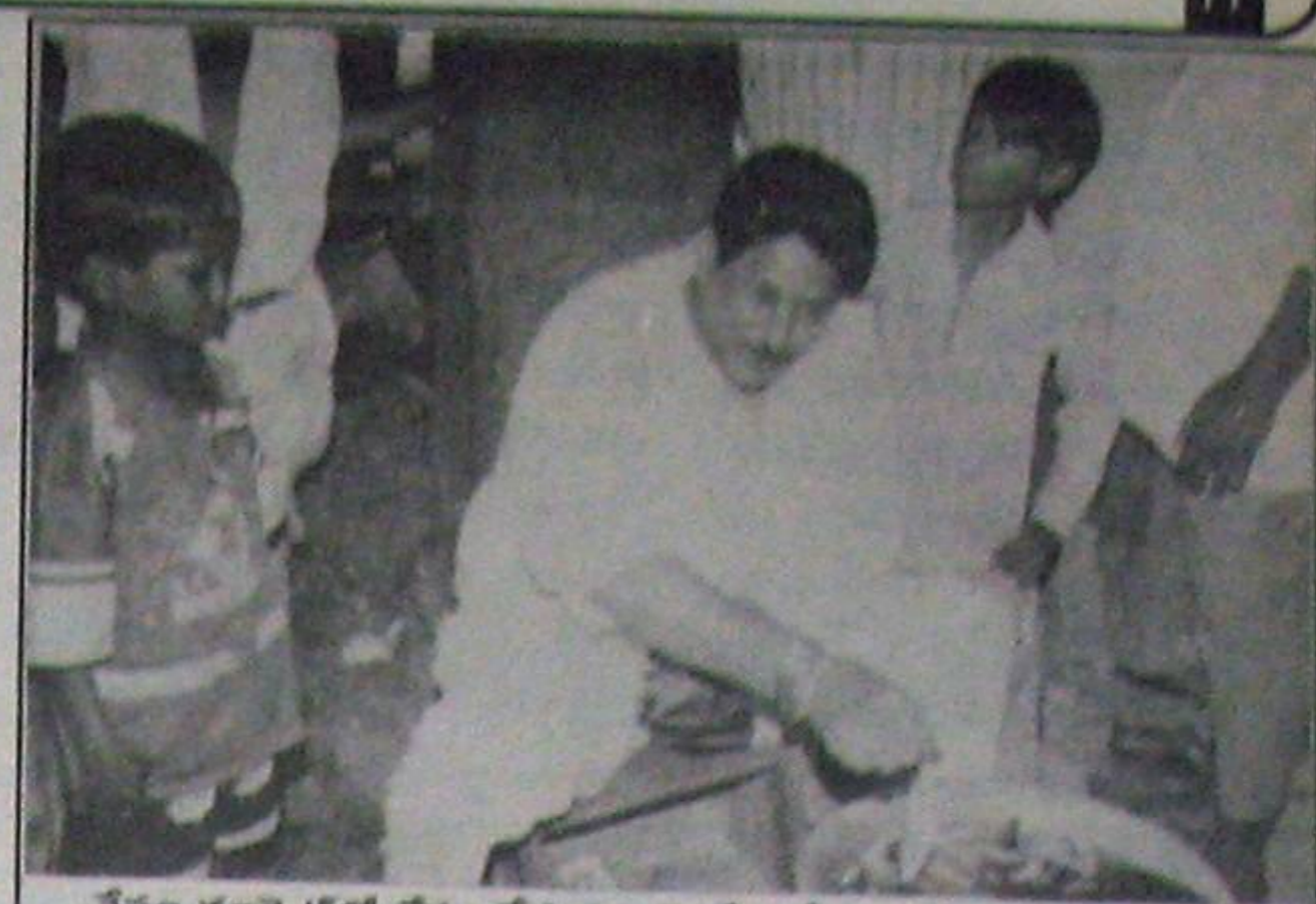
చేపల మార్కెట్లో టీరం చేస్తున్న ఎమ్మెల్యే బవేలా - నీచ నిర్వహణగా పున్న ఈ మార్కెట్ బాగుపడేదాగ్గుడు నాయకులు!

4వ పేజీ కొరవ తొలగింపుల కార్యక్రమం చేపట్టలేక పోయింది. ఇప్పటి ఎస్పీ శ్రీనివాసరెడ్డి