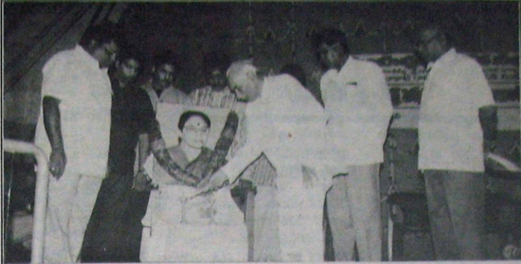
ఈనెల 10వ తేదీన మహిళా శాఖలో పాల్గొన్నవారు తెలిపారు. శిక్షణ కొనసాగిన 10 రోజులలో ఒక్కరోజు కూడా అవసరమైన విషయాన్ని చెప్పించలేదట. పోస్టు గ్రాడ్యుయేట్, డిప్లొమా వంటి ఉన్నత చదువులు చదివిన వారు కూడా పాల్గొన్న ఈ శిక్షణ తరగతులలో పారిశ్రామిక అధికారులు, బ్యాంకు మేనేజర్లు పాల్గొని, తామందరినీ మోసగాళ్లగానూ, దొంగలగానూ చిత్రీకరించి మాట్లాడారని వాపోయారు. గత సంవత్సరం డిశంబరు 6తేదీ జరిగిన బెత్తాపాక వేత్తల అవగాహన సదస్సులో వంద మందికి పైగా పాల్గొనగా వీరి నుండి 24 మందిని ఎంపిక చేశారు. వీరిలో నలుగురు మహిళలు కూడా వున్నారు. ఎంపిక చేసిన ఈ 24మంది కాబోయే పారిశ్రామిక వేత్తలకు 10రోజుల పాటు శిక్షణ తరగతులు కావాలి అని మండల కార్యాలయంలో నిర్వహించారు. తాము ఎందుకున్న పరిశ్రమను ఎలా స్థాపించాలి? కొరవ 8వ పేజీలో

సీక్రారం చేయాలి అని కొందరు ఎన్టీఎం నేతలు చిత్తుగా తాగి ఉండటంతో, వారిని చేతులపై వేదిక మీదకు మోసుకపోవాలి అని దుస్థితి ఏర్పడింది. ఎన్టీఎం ప్యానల్ కు మద్దతుగా రాజకీయ పార్టీలు, కుల సంఘాలు రంగంలోకి దిగి ప్రచారం నిర్వహించడంతో, ఎన్టీఎం