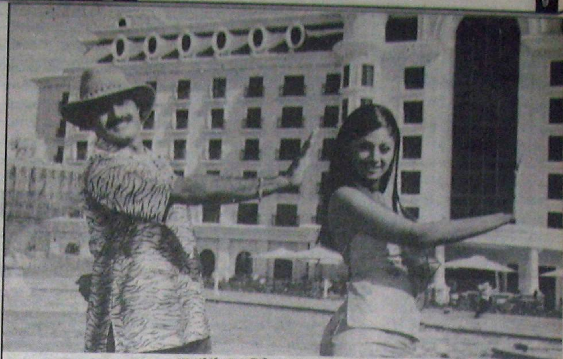
బాలకృష్ణ, నిర్మాతలతో ఆగుందగ్గుళ్ళ పరపశం.

మహేష్ బాబు నటించిన యువరాజు, వంశీ చిత్రాలు ఫ్లాప్ అయ్యాయి. కృష్ణవంశి దర్శకత్వంలో నటించిన మురారి చిత్రం వంద రోజులాడినా ఆ చిత్ర నిర్మాతకు మహేష్ బాబుకు విభేదాలు తలెత్తడంతో శతదినోత్సవాన్ని జరపలేదు. సంక్రాంతికి విడుదలైన బక్కరిదొంగ సినీమా బాగుందన్న టాక్ వచ్చినా వందరోజులు ఆడే అవకాశం