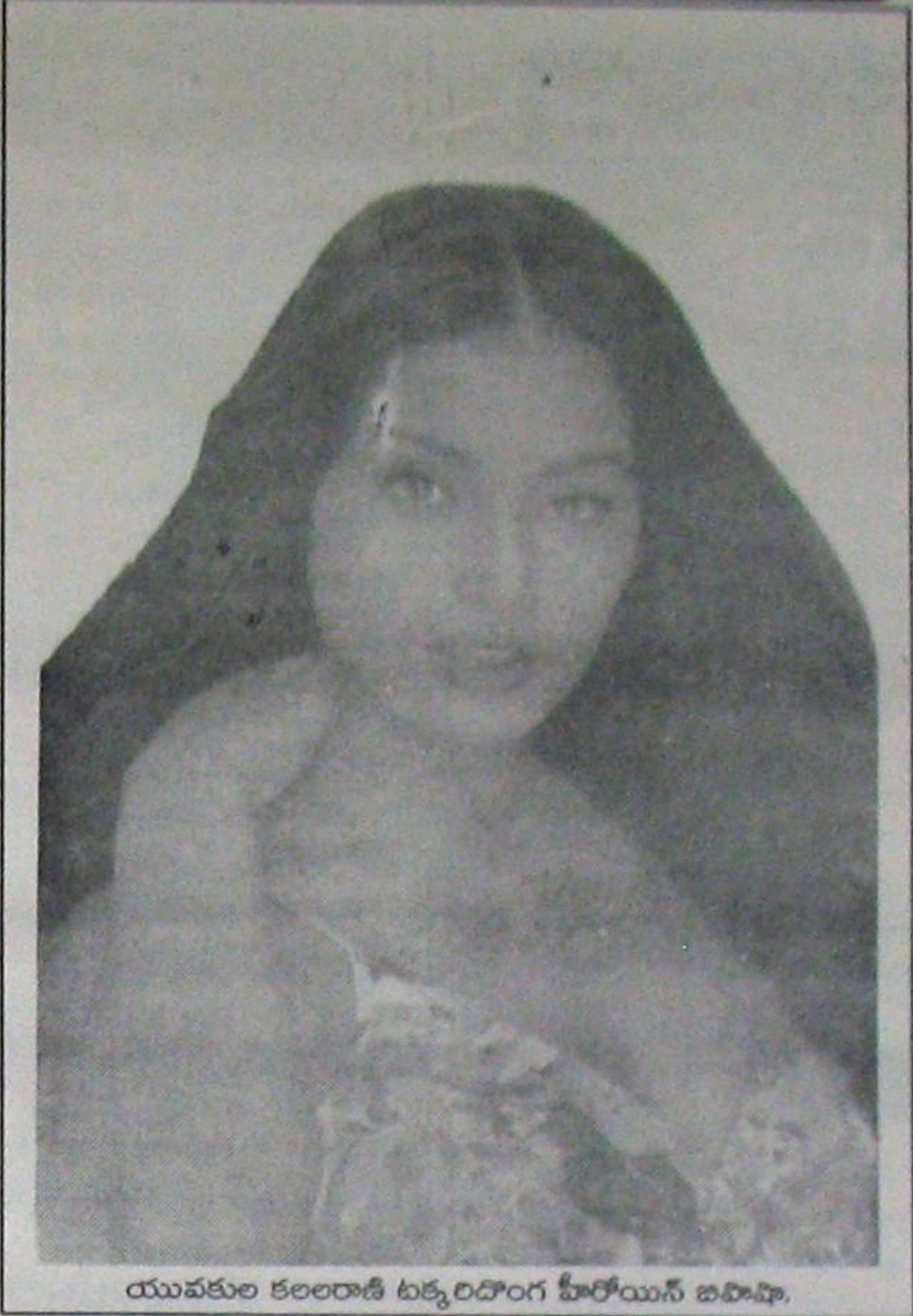
యువకుల కలలరాజి టక్కరిదొంగ హిరోయిన్ దియామీరా.

పాప్ మ్యూజిక్ ఆల్బం రూపొందిస్తున్న మీనా తెలుగు, తమిళంలో వేషాలు