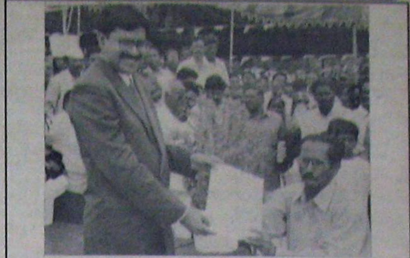
ఉత్తమసేవలకు కలిగిన అనంతరాము చేతులకుడుగా రివల్వ్యూరీ పరిధిలో ప్రసారావత్తం తీసుకుంటున్న ఐపిటిల సంఘ సీక సి. ద.బి.బి.బి.బి.బి.

నేర పరిశోధనలో ముఖ్యపాత్ర వహించి, క్లా దొరకని పలు కేసుల్లో మిస్టరీని ఛేదించే వెనుక చాలా మందికి తెలియని, గుట్టుచప్పుడు కాకుండా పనిచేసే పోలీసు వ్యవస్థ వేలిముద్రల విభాగం. నెల్లూరు పోలీసు ఆఫీసులో ఈ విభాగం కూడా ప్రత్యేకంగా పనిచేస్తూ వుంది. ఈ మధ్య ఈ విభాగాన్ని ఆధునికీకరణ చేయడం వల్ల 15వేది నేరస్తులను సులభంగా గుర్తించారు. జిల్లాలో ఎక్కడైనా నేరం జరిగితే అక్కడి ఎస్ఐ వెంటనే ఈ వేలిముద్రల విభాగానికి తెలియజేస్తారు. వెంటనే రంగంలోకి దిగి వేలిముద్రల విభాగం పోలీసులు నేరం జరిగిన ఇంట్లో నిశితంగా పరిశీలించి నేరానికి