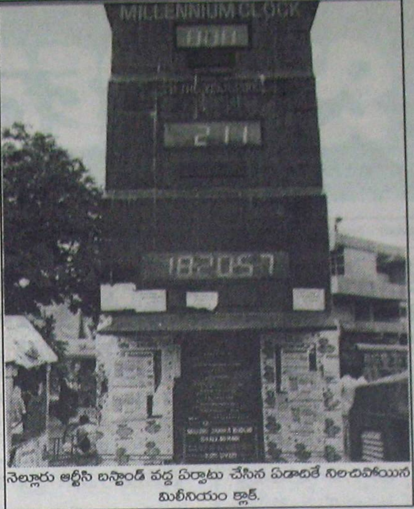
నెల్లూరు అల్లీసి బస్టాండ్ వద్ద ఏర్పాటు చేసిన ఏడాదికే నిలబడబోయిన మిలీనియం క్లాక్.