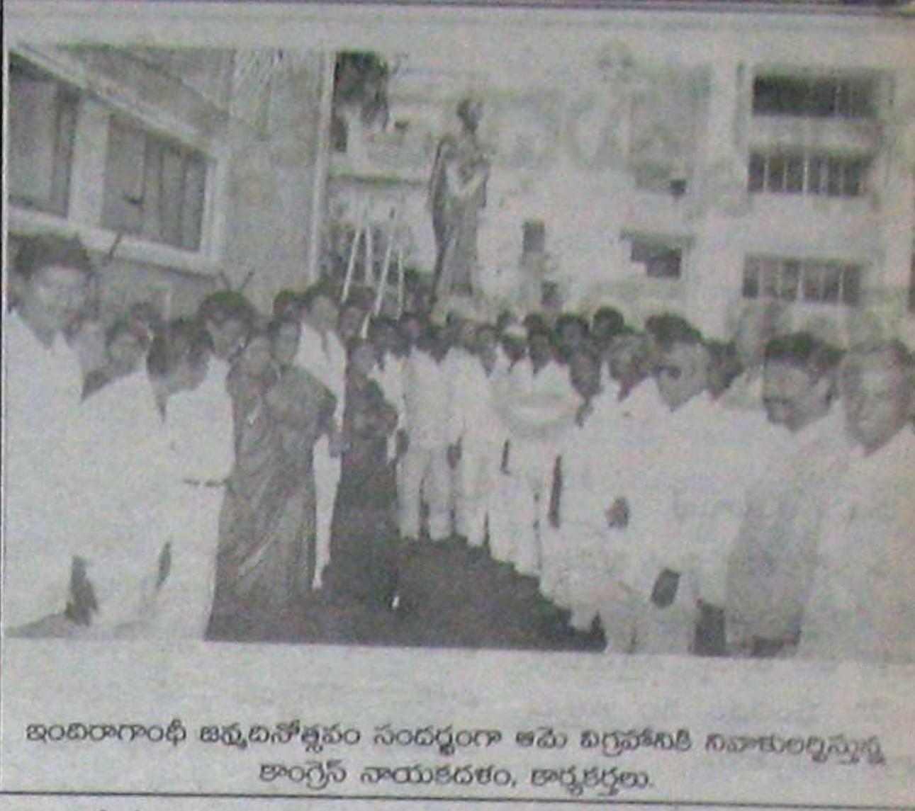
ఇందిరాగాంధీ జ్యుబిలీస్ట్రోవం సందర్భంగా ఆమె విగ్రహానికి గువారులర్చిస్తున్న ఆంగ్లీస్ నాయకదళం, ఆర్మీకర్నలు. పత్రికలో ప్రాధాన్యత కల్గిన వార్తలుగా చోటు చేసుకోవడం మరి పెద్ద వాషివం. వీరధర్మి మధ్య సంబంధాలలో ఏదైనా తేడా వచ్చిందా అన్న సందేహానికి దారి తీస్తున్నాయి ఈ వార్తలు. అదే నిజమైతే మాత్రం చంద్రబాబుకు ముందున్నదంతా ముసల్ల పండగలే - పాపం. ఈవారు కన్నెర్ర చేస్తే తట్టుకోగల్గి సోమం ఆయనకి కాదు. ఇప్పటిలో ఏ రాజకీయ వాదికి లేదు మన రాష్ట్రంలో.

ముఖ్యమంత్రి ఒక దాని వెంట ఒకటిగా ఇట్లా తప్పులు చేస్తూ దొరికి పోవడం ఒక వాషివైతే - అవి ఈనాడు