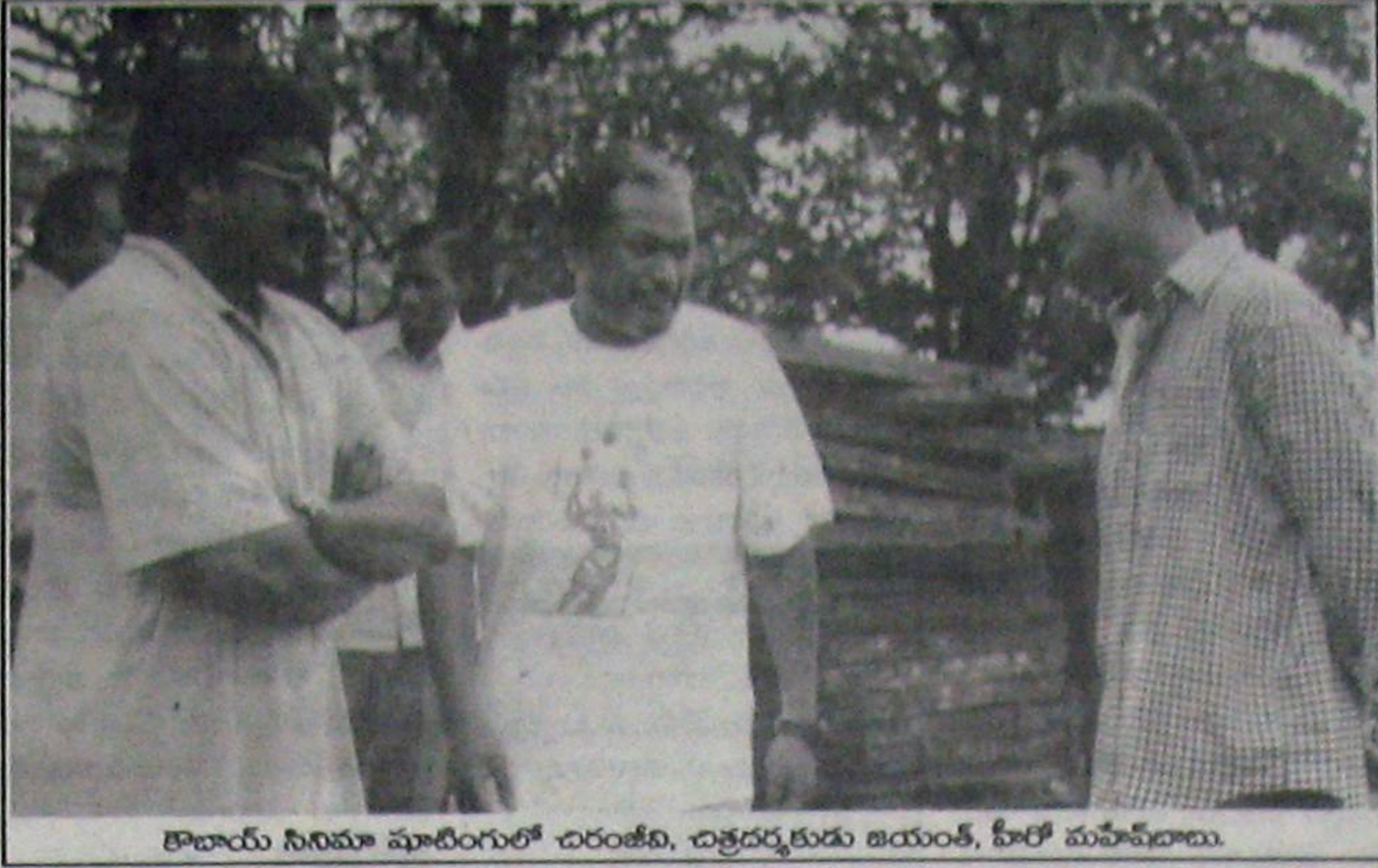
కొబారు సినీమా మూడింగులో చరంజీవి, చిత్రదర్శకుడు బియంకే, హీరో మహేష్ బాబు.

సినిమాల్లో వేషాలు తగ్గి వంపు సొంపులు నడలి పోయే ప్రతి హీరో, హీరోయిన్లకు ఇప్పుడు రాజకీయ రంగమే పునరావాస కేంద్రంగా వుంది. మాటి విశ్వమందిరి లారాదత్తా కూడా ఇప్పుడు అదే బాటలో వున్నట్టుంది. తన దృష్టంతా రాజకీయాల మించి వున్నదంటుంది లారా దత్తా. దేశ ప్రజలకు సేవ చేయడానికి రాజకీయాలే చక్కని మార్గమంటుంది. ప్రస్తుతం ఒక తమిళ చిత్రం, మరో రెండు హిందీ చిత్రాల్లో నటిస్తున్న లారాదత్త గతంలో ఐక్యరాజ్య సమితిలో ప్రపంచ శాంతికి కృషి చేసే బృందంలో సభ్యురాలిగా పనిచేసింది. ఇదో గొప్ప అనుభవం. దీన్ని మరవలేను ప్రపంచ తార 11వ పేజీలో