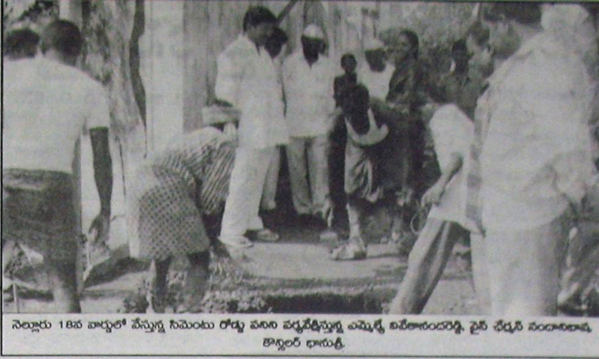
నెల్లూరు 18వ వార్డులో వేస్తున్న గుమెంటు రోడ్డు పనుల వ్యవస్థీకృత అమ్మిళ్ళి బలహీనందార్లకి, ధైరీ చేద్దని సందేశాలను తార్గెటర్ భానుక్కి.

దీన్ని బట్టి అర్థం చేసుకోవచ్చు నెల్లూరు మునిసిపాలిటీకి బయట ప్రాంతాల్లో వున్న పేరు.