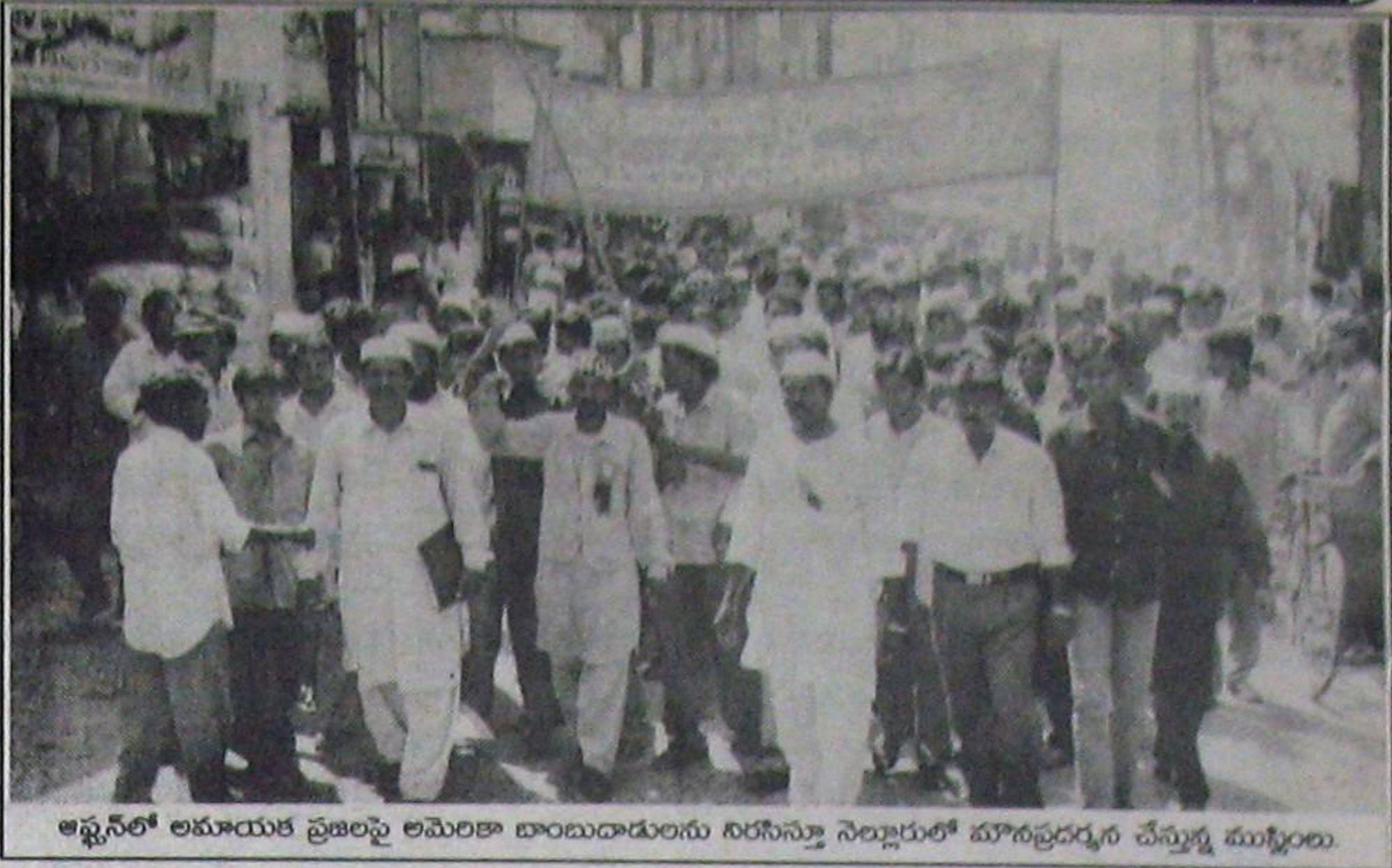
అఫ్సెన్లో అమాయక ప్రజలపై అమెరికా బాంబుదాడులను నిరసిస్తూ నెల్లూరులో మౌనప్రదర్శన చేస్తున్న ముస్లింలు.

కడప, అనంతపురం జిల్లాలకు మొదటి దశగా రాష్ట్ర ప్రభుత్వం 40కోట్లు మంజూరు చేసింది. కాల వారీగా నష్టాల అంచనాల వివరాలు ఇంకా తయారు కాలేదు. జిల్లాలో పంచాయతీ రాజ్, ఇరిగేషన్ కాలను చెరువులకు పడిన గండ్లకు యుద్ధ ప్రాతిపదికన రింగు బండ్లు ఏర్పాటు చేస్తారు. అవసరమైనచోట చెరువులకు కాశ్యత మరమ్మత్తు పనులు చేపడతారు. జిల్లాలో ఇప్పటి వరకు 190లక్షల రూపాయల నగదు వరద బాధితులకు పంపిణీ