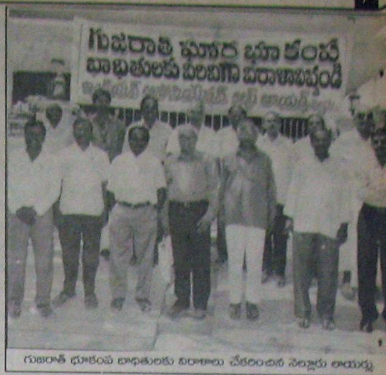
గుజరాత్ ధూరంప బాధితులకు విరాళాలు చేకరించిన నెల్లూరు తాయర్లు

ప్రయోగం వుండదు. ప్రజాభిప్రాయానికి వ్యతిరేకంగా పరిపాలన సాగించిన ప్రభుత్వం చరిత్రలో లేదు. కొంత కాలం మాత్రమే ఈ బ్రూటల్ మెథాడ్లు రక్షణ కవచం కల్పించ గలవు; ఆ తర్వాత అందుకు తగిన మూల్యం చెల్లించక తప్పదు. చంద్రబాబుకు ఈ నిజం అర్థం కావడం లేదు. తాను మహా మేధావి అని, ప్రజలను మభ్యపెట్టడం తనకు తెలివితేటగా మరెవరికీ తెలియదని ఆయన నమ్మకంగా కన్పిస్తున్నది. ఎవరి ఏమి వారికి ఆనందం.