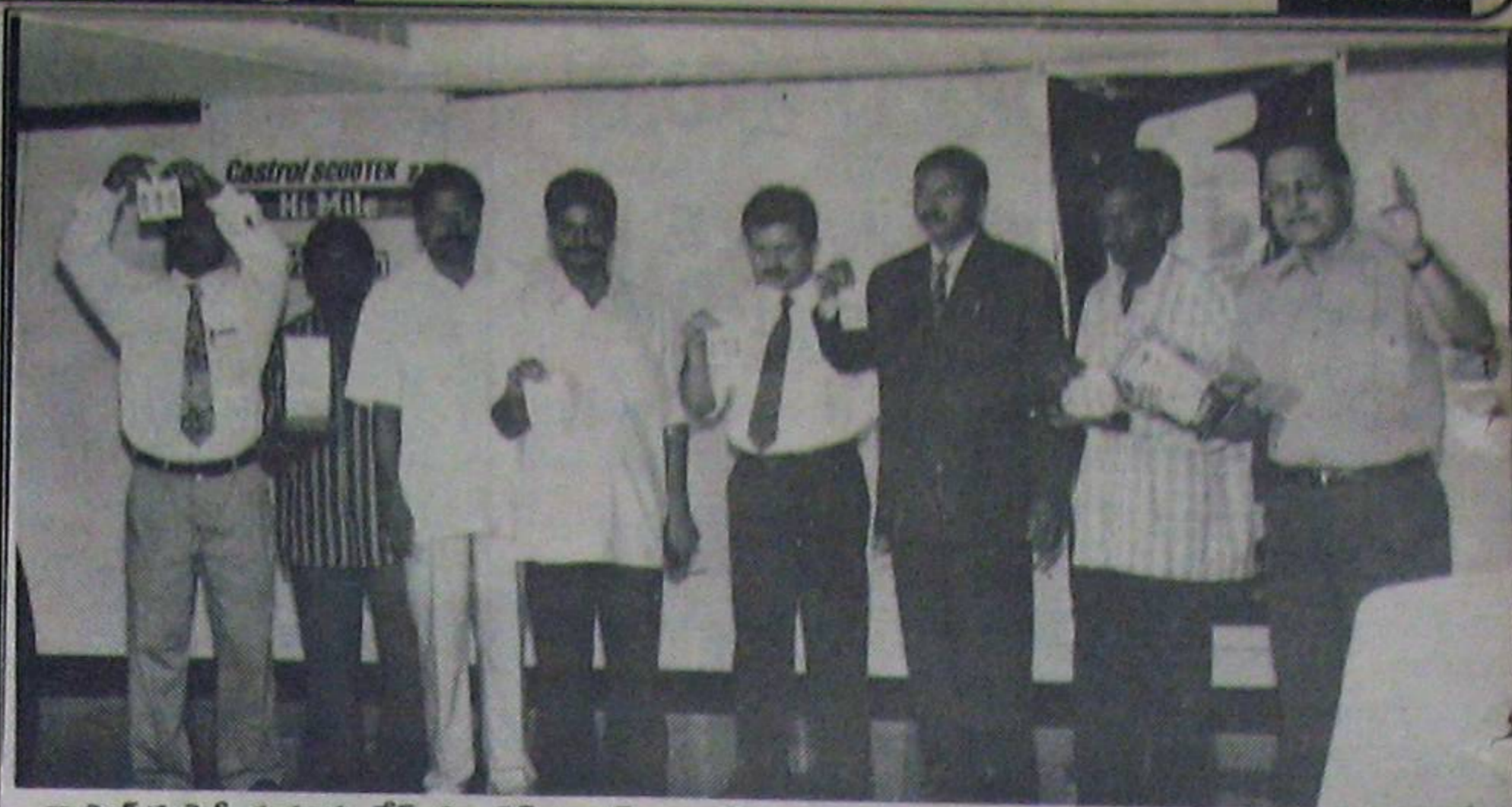
కాస్టోల్ కంపెనీ తయారు చేసే స్కూటర్లకు ఇంజనీ ఆయిల్ ను నెల్లూరు మార్కెట్లో ప్రవేశపెడుతున్న కంపెనీ ప్రతినిధులు, సురభి ఏజెన్సీ గిర్వాహకులు.