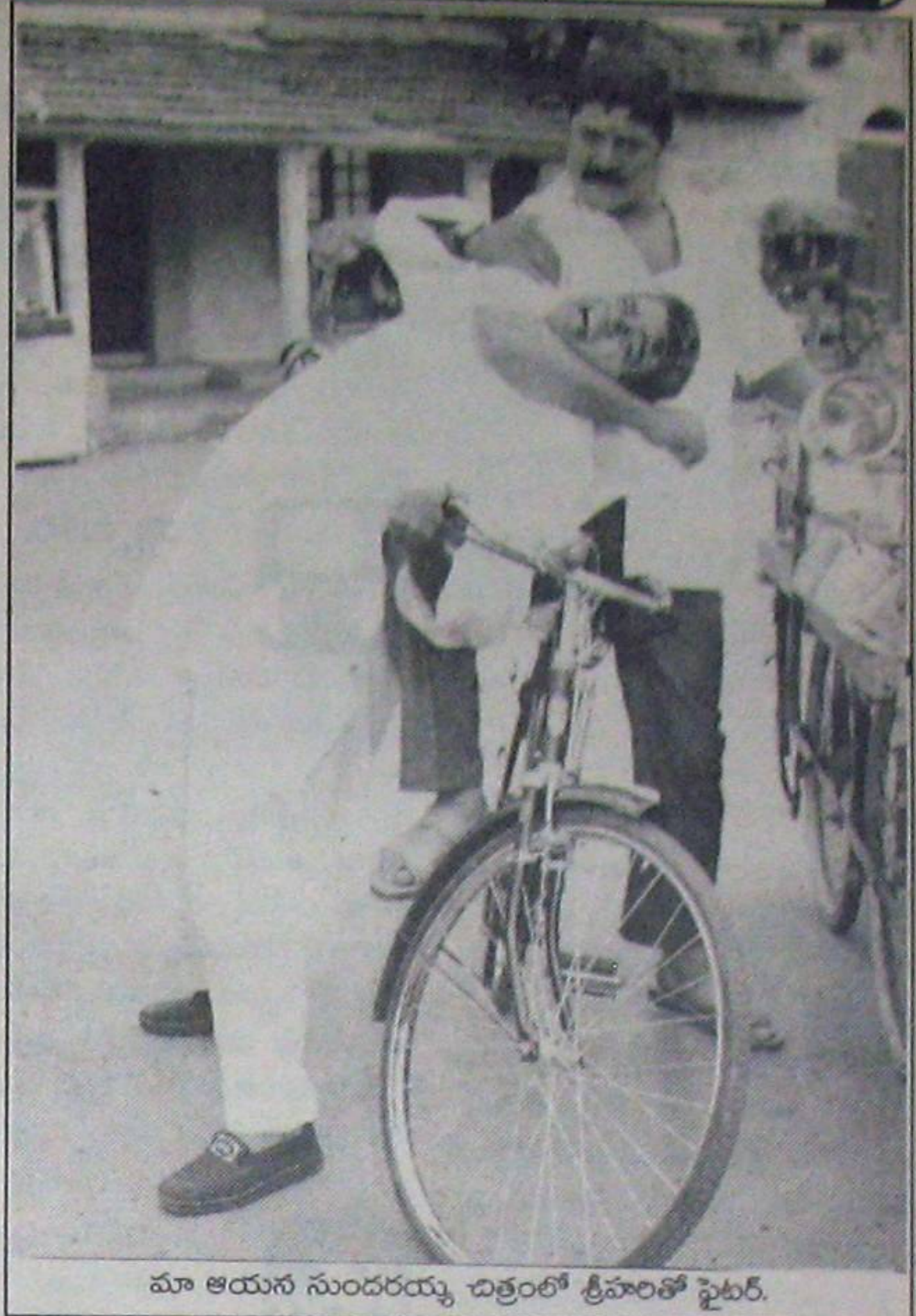
మా ఆయన నుండరయ్య చిత్రంలో శ్రీహరితో ఫైటర్.

మా ఆవిడ చాలా నిరాడం బరురాలు. అందుకే ఆమెను నేను అభిమానిస్తానన్నారు దర్శకుడు ఇవివి. సత్యనారాయణ. నేను దర్శకుడు కాముందే మాపెళ్లి జరిగింది. పరిశ్రమకు రాక ముందు నేను ఎలా వున్నానో ఇప్పుడూ అలాగే వుంటుంది. మంచి డైరెక్టర్ గా ఎదిగి ఇంత సంపాదిస్తున్నా, మా ఆవిడ మాత్రం నన్ను ఏ రోజూ ఇది కావాలి, అది కావాలని అడగదు. మాటింగులకు విదేశాలకు వెళ్తున్నా అది తెండి, ఇది తెండని అడగదు. కాదున్నా తన పనిని బస్సులో వెళ్లి పూర్తి చేసుకొని వస్తుందన్నారు ఇవివి.