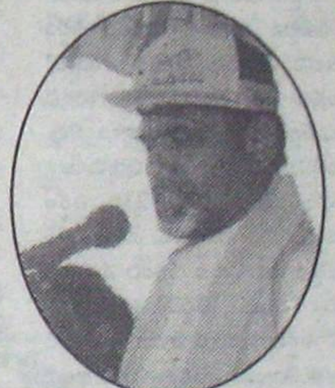
సుప్రీంకోర్టు తీర్పు రాజకీయ మరణశాసనం కానున్నదా?

పరిపాలనా విధానం సమస్తం కేంద్రీకృత పద్ధతి. రాష్ట్ర మంత్రులను డిమాండ్లుగా మార్చి వీడియో, టెలిఫోన్లతో నేరుగా అధికారులకు ఆదేశాలివ్వడం చంద్రబాబు స్టైలు. కలెక్టర్ నుంచి ఏపీ సెక్రటరీ వరకు నేరుగా సెలెక్షన్ సంబంధం. ఆ ధోరణికి అలవాటుపడిన వాడికి పంచాయతీలు, మండలాలు,