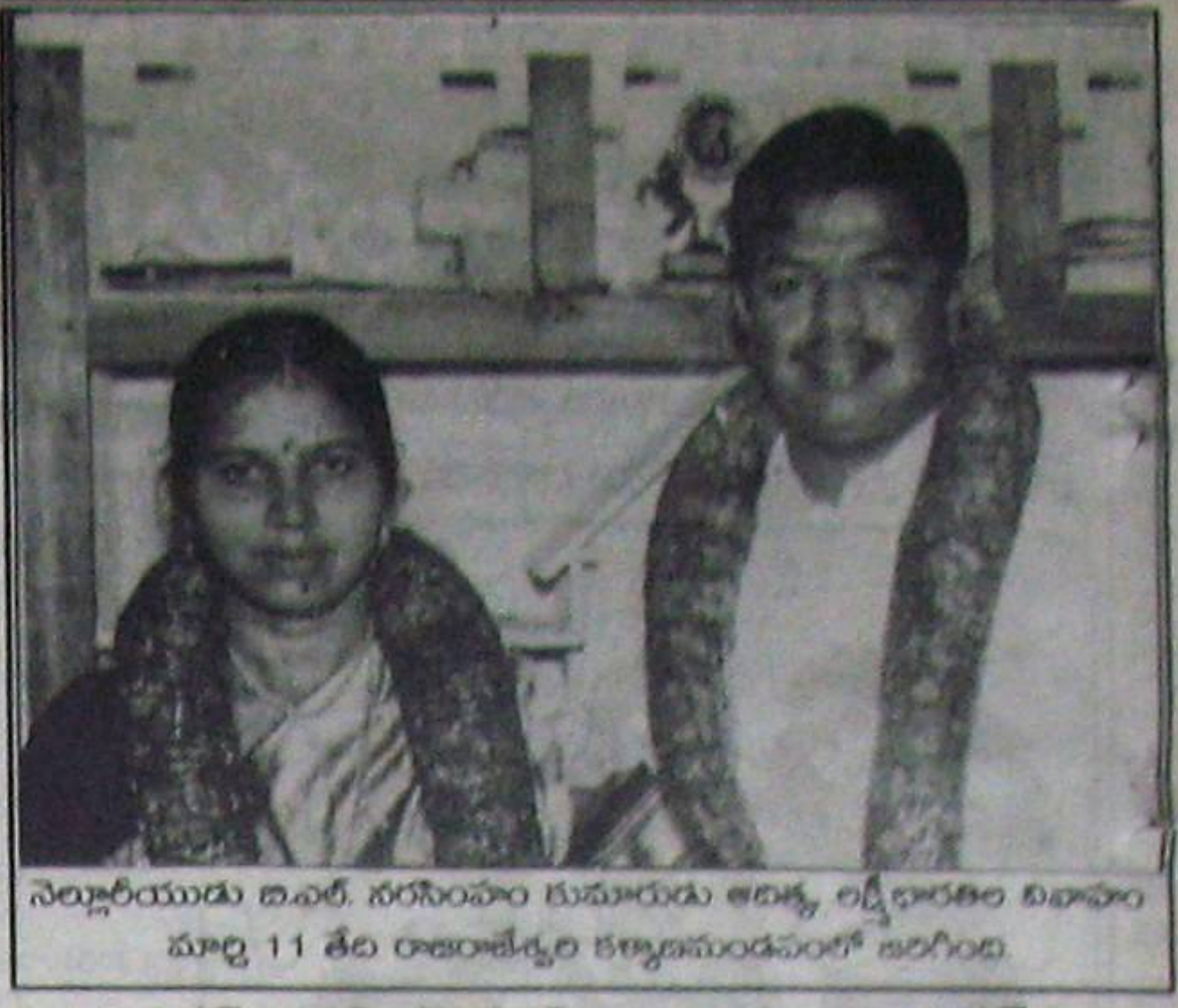
నెల్లూరు యొక్క ఐ.ఎ.ఆర్. సరసంపాం కుమారుడు అధ్యక్షుడు, లక్ష్మీధారణల వివాహం మార్చి 11 తేది రాజంపేటలో కల్యాణముండవంటి జరిగింది.

ఐఎంఎకు కొత్తకార్యదర్శి డాక్టర్లు ప్రతిష్టాకరంగా భావించే