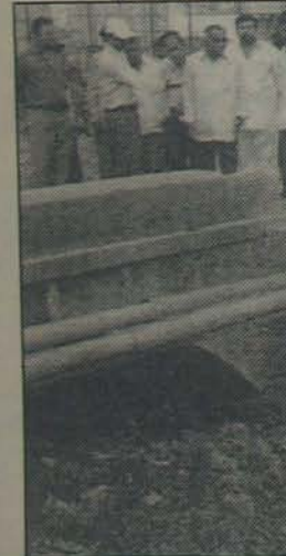
చెన్నైలో పూడిపోయిన ఆయనకు కార్యాల పంపిణీపై కర్ణాటక ప్రభుత్వం

అక్కడ జరిగిన ఒకానొక సంఘటన ఆలయ స్థాపనకు కారణభూతమయింది. ఇప్పుడు కోనేరు పున్న ప్రాంతంలో పూర్వం వ్యవసాయుడు దాని వుండేది. మూగ, చెవిటి, గుడ్డివారైన ముగ్గురు అన్నదమ్ములు ఈ దానిపై ఆధారపడి వ్యవసాయం చేసేవారు.