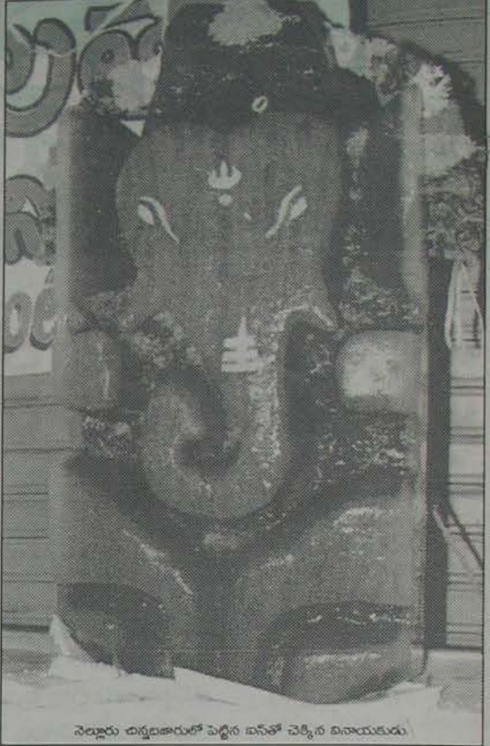
నెల్లూరు చిన్నదారులో పెట్టిన ఐసోత్ చెక్కిన విణయకురు

తగులపెట్టారు; పంటలు నాశనం చేశారు; ఇళ్లు, ఇతర ఆస్తులు ధ్వంసం చేశారు; ప్రజలను అనేక విధాలుగా హింసించారు. వీరి విధ్వంసం నెల్లూరు జిల్లా మాడుగా గుంటూరు వరకు సాగింది. దీని ఫలితంగా పంటలు లేక ఆహార ధాన్యా వ్యవస్థ అవినీతితో కుర్చి పోవడానికి