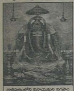
కాణిపాకంలోని వినాయకుని విగ్రహం

ఈ క్షేత్రం అతి పురాతనమైనది. వసంతి రాజస్వామి ఆలయం ప్రాచీన