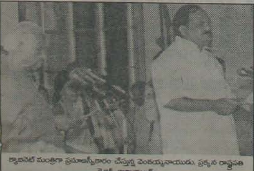
జమీన్దార్ల మంత్రిగా ప్రమాణస్వీకారం చేస్తున్న వెంకయ్యనాయుడు, ప్రక్కన రాష్ట్రపతి కె.వి. గొంతులపాటి