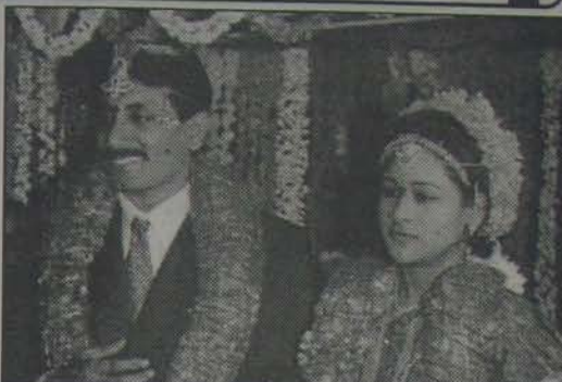
గ్రామపూజార్థి నాయకుడు దేవత దేశధర్మాలపైకి మునుముంబుల రమ్మ, వననీలమూరలపైకి వివాహం మూర్తి 16 తేది నెల్లూరు ఇంకావ కళ్యాణమండపంలో అంగం.

రాగమాలిక నవల ప్రవాహంలో ఒక సారి పడన ప్రయాణం చెయ్యండి. ఇది అందరూ చెయ్యతగ్గ ప్రయాణం. *