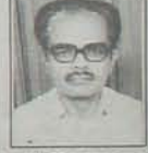
రమణయ్యను "ప్రెస్ సిటీజన్ అండ్ గండయన్ ఫౌండేషన్" ఫౌండేషన్ 7వ ఏతలో