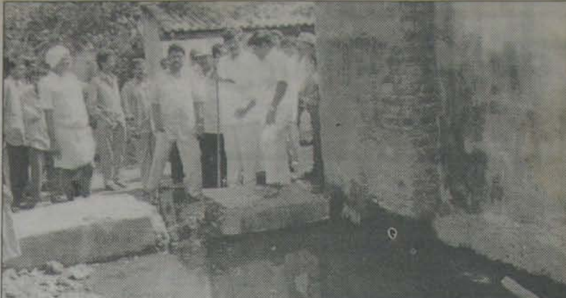
నెల్లూరు, బాలాశాసనగర్ 11వ లక్షలలో నుండి వున్నవూ డొరువు వరకు వున్న జమ్మివారు సూడితలక పనులను ప్రారంభిస్తున్న కార్యక్రమంలో కలెక్టర్ ప్రధానంగా రెడ్డి, ప్రకృతి మాజీ ఎమ్మెల్యే రమేష్ రెడ్డి.

పచ్చాపాడు కార్యక్రమంలో పాల్గొన్న కావలి ఎమ్మెల్యే కలెక్టర్ క్రిలక్షి ఈ ప్రాంతాల్లోను నీరు లేక తమ పంటలు ఎండిపోతున్న విషయాన్ని తీసుకొన్నారు. తీసికొ వెనుకొంటున్న పురందించ కలెక్టర్ కావలి కాలువ, బలరంజి చెరువులను పరిశీలించి, గారవరం చేప