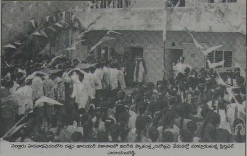
నెల్లూరు హిందూపురంలోని రక్షం జాగయర్ కళాశాలలో జరిగిన స్వాతంత్ర్యదినోత్సవ వేడుకలో ముఖ్యఅతిథుల సత్కారం జరిగింది.

తూర్పు, ఉత్తరం గోపుర ద్వారాల వల్ల ఆ వాగ్గు తెరచినట్టుయితే ఇంద్ర,