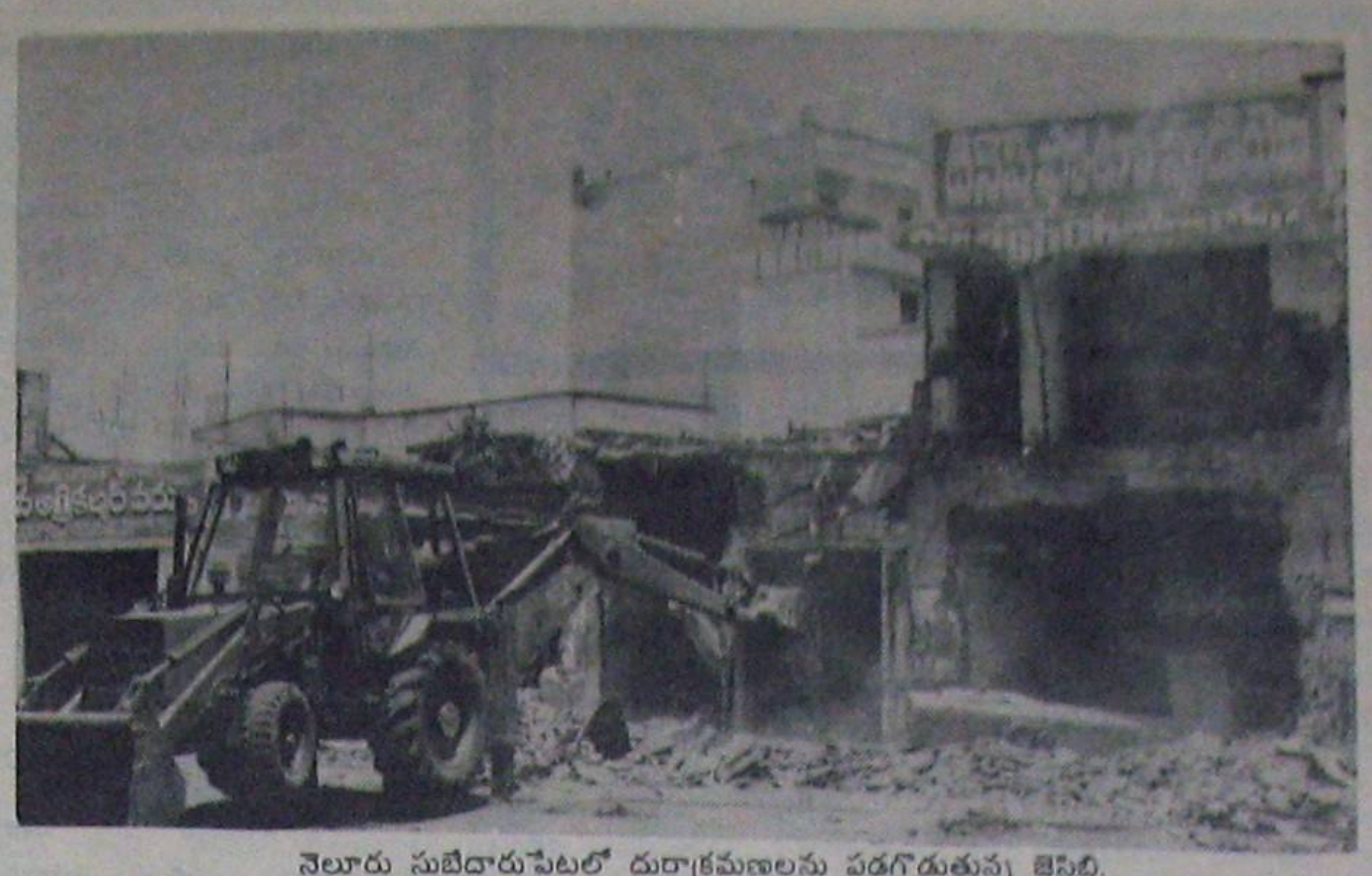
నెల్లూరు సుబేదారుపేటలో దురాక్రమణలను పడగొడుతున్న జిసిడి.