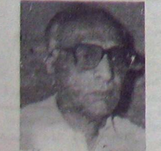
చీఫ్ ఇంజనీరు శాస్త్రీయంగా వాళ్లెపించి చెప్పన్న సమాచారం కాబట్టి అది ఎంతో సీరియస్గా తీసుకోవలసిన విషయంగా భావించాలి.

అదేకొందరట. కాని ఆయన్ను ఒకే ఒక్క నెలలోపల అక్కడి నుంచి బదిలీ చేసి, తమ చిత్తం వచ్చినట్లు నిర్మాణం పూర్తి చేశారు.