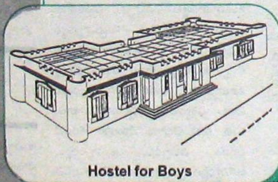
Hostel for Boys