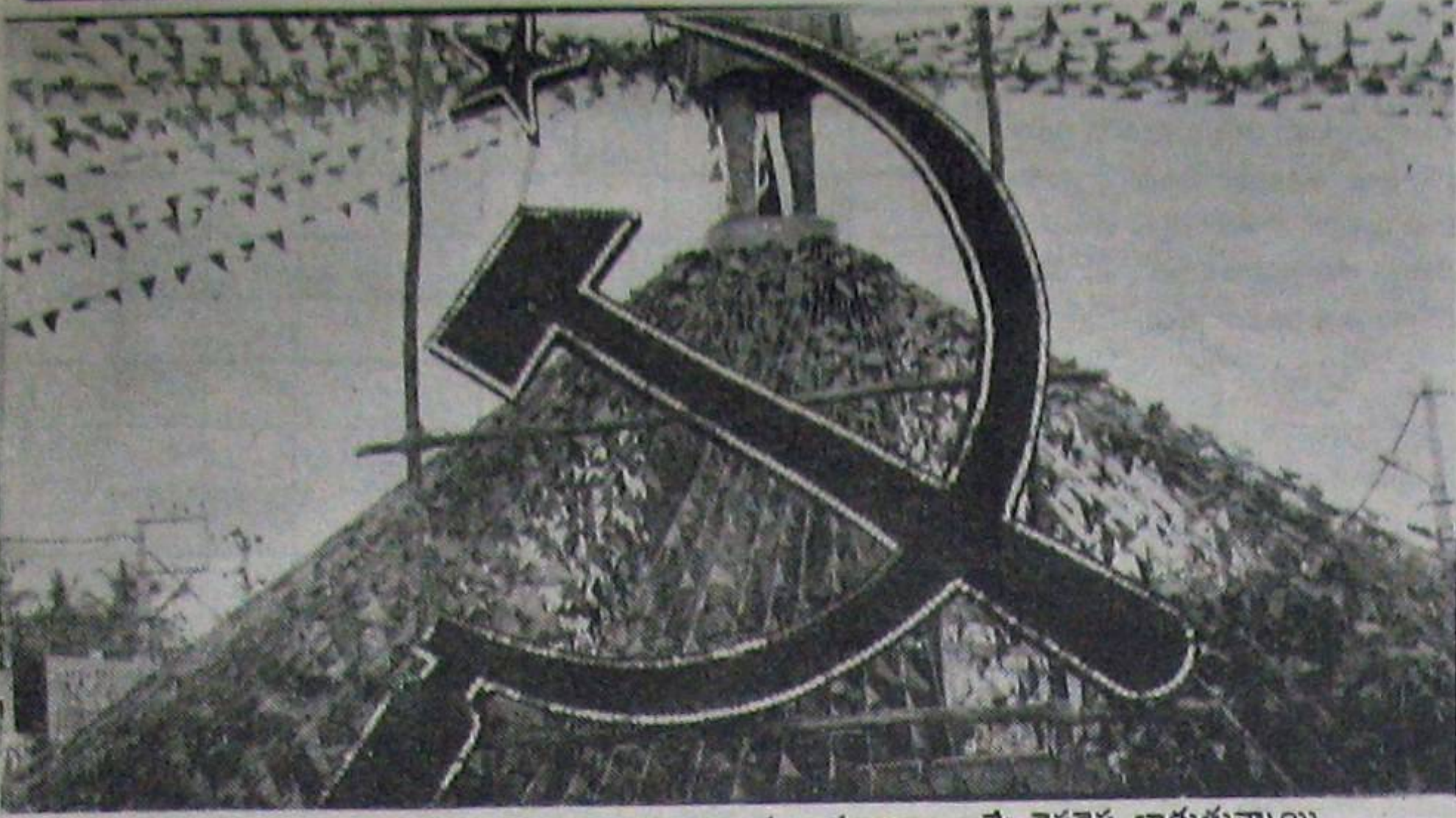
సుందరయ్య విగ్రహవిష్కరణ సందర్భంగా టౌనంత్ అరుణ పతాకాలు ఇట్టే రెపరెప లాడుతున్నాయి.