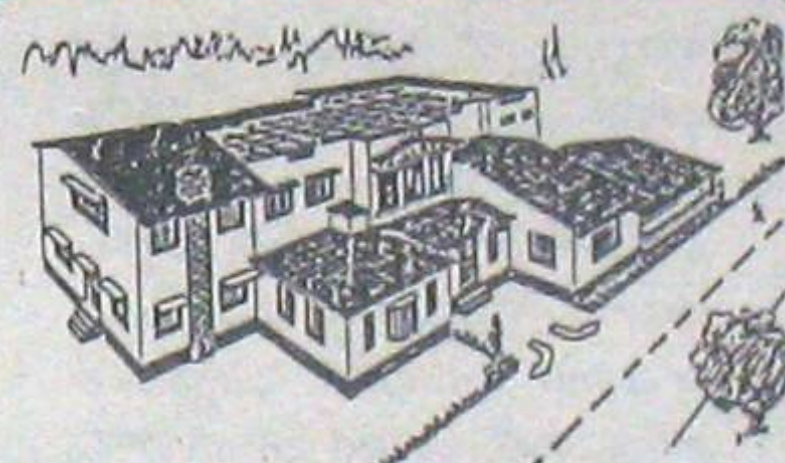
Hostel for Girls