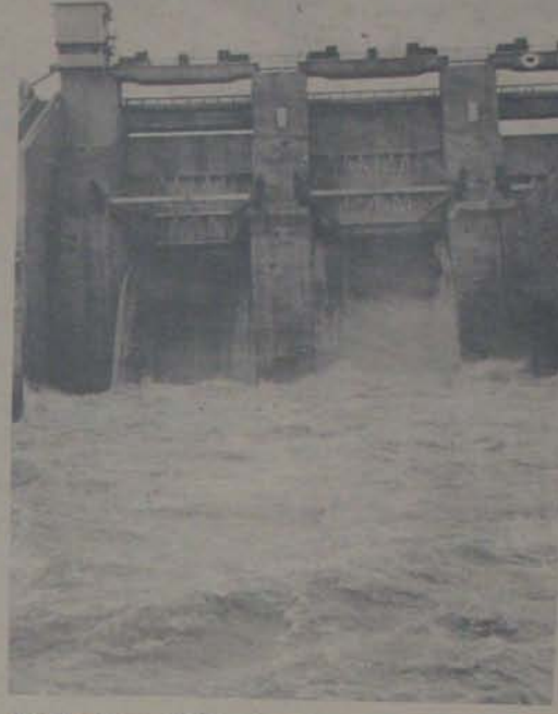
మన చేతకానిననాన్ని గేరివేస్తూ గలగల మంటూ వరద గేట్ల నుండి క్రిందకు దూకుతున్న సోమకలంబింది.

కొరిమిలో కలిగి కాలలు కట్టిన అపారమైన ప్రాజెక్టు దారలు పుర్రణలు వెస్తున్నాయి. నివేదిక, లిఫ్ట్ మర్చి వీధి అయ్యి వెలుగు తారితోతున్న అపారమైన రాఖిలా కన్పిస్తున్నాయి. ఎన్ని నీళ్లు? ఎంతటి ప్రవాహం? వృధాగా, రందగంగా, దుబారాగా వెళ్తున్న కడుపులోని అపారమైన అపారమైన కలిగిస్తూ కలిగికి చేరువ కాను తొందర పడుతూ వెళ్లిపోతున్నాయి. అంతటికంటే ప్రారంభమైన ఈ మూడునెలల్లో 70 టిఎంసెల్ నీరు ఇల్లా డ్యాం నుండి క్రిందకు తారితోయాయి. ఎక్కడికి, దివికి నీటికో పరివేల ఎక్కడాల వెలిపింది పండించవచ్చు వృధాగా సముద్రంలో కలిసిపోయిన ఈ 70 టిఎంసెల్ నీరు 7 లక్షల ఎకరాల పొరులకు పరిపాలిస్తుంటేది. ఒక్క ఎకరాలలో పండి వరి పంట వెలుప 10 టెల రూపాయలని భావస్తే - ఈ 7 లక్షల ఎకరాలలో 700 కోట్ల పంట ఉత్పత్తి సాధ్యమయ్యేది. ఆ నీటి సంతకటిని భద్రంగా దాచి పెట్టుకొని వుంటే - నెల్లూరు, కోపూరు డెల్టాలు; కావలి, కనుపూరు కాల్యాలు; కండ్లెరు