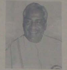
వ్యాఖ్యానించారు. ఈ అవకాశాలు ఏంటి

రాయలసీమ సాగునీటి వనతి కల్పించే మొదట లక్ష్యాన్ని పట్టణం, తెలుగు దేశం ప్రభుత్వం ఆ వనతి కల్పించి తెలుగు గంగ పథకం రూపొందించినది"