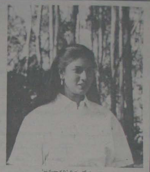
'అమరావతి' చిత్రంలో సుమతి

దర్శకత్వంలో "చిన్నబ్బాయి" ప్రజానికే అంటే మారినదిలో నేనుంటే పాటలు ఏకైకమేమిటోనో వచ్చాయిమీద విశ్వాస వనసంపాదన. "అంత దూరం వెళ్లి మాదింగ్ బరవడంలో వాణిమేమిటి?" అని అడిగితే, "అక్కడ వస్తుండం ఏలంగా ఉంటుంది. అలాగే కూడా ఎంతో నీలంగా ఆహారంగా ఉంది." 15వ 11 పెకల్