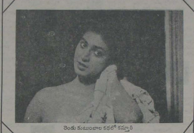
రెండు కుటుంబాల కథలో కస్తూరి

తారలు ఎలాంటి విషయాలకు అవిపేద అవుతారో తెలిస్తే పవనైనా పుష్పలోక తప్పదు. "అబ్బాయిగారు" చిత్రం తమిళంలో "చిన్న యజమాని"గా డబ్ చేయబడు తోందని తెలిసి మీనా తప్పి పడింది. "తమిళ సినిమా రంగంలో మర్కట్యూనికొందికి నేను ప్రయత్నిస్తున్న తరుణంలో ఈ దర్శింక పేర్కొర పెడుగులవడం ఎంత దురదృష్టకరం. ఆ తెలుగు చిత్రంలో కొన్ని సీన్లలో చాలా గెప్ట్ దుస్తుల్లో కనిపించాను. తెలుగు ప్రేక్షకులకు అపాతాదులో గెప్ట్ కనిపించడం అవసరం గనుక తప్పలేదు.