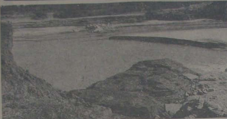
రెండు వారాలకు పైనే రైతుల సడవకుండా చేసి, రెండు వందల మంది ప్రాణాలు బలిగొన్న రాళ్లపాడు చెరువుకు పడిన గండి ఇటి!