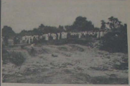
వెంకటగిరి దగ్గర కయ్యూరు చెరువుకు పడిన గండ్డి