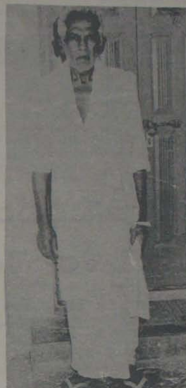
రెంతుడు మోసానీది నాదని యాంటామ్! కొన్నాళ్ళ పొటుయెన నీవెం దుంటావో లేదో. తెలియని తంటాలివి తెలుసుకోక తమ్మాయివస్తా! (జమీన్ రైతు శివారత్తి పద్యాంధ్రం నుంచి)