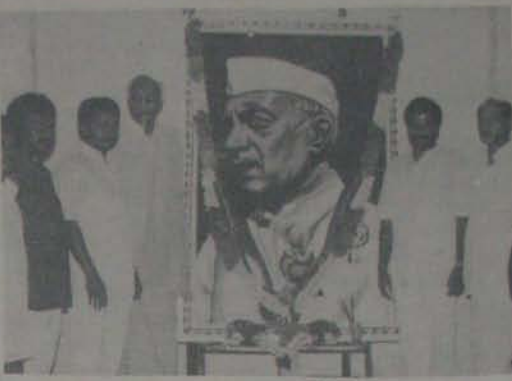
వైద్యులు వర్తించిన పురస్కారం చూడండి ఇందిరాజీవ్ లోని వైద్యులు విశ్రమించి కి నివాళు అర్పించును దీనిని అర్పించుట అసంసరితకై, వైద్యులు దేవరూపారై కై, సునీలకుమారై కై, మాతీ ఎమ్మెల్యే కై, సుబ్బారై కై

అనే పదాలు గమనించడం, అనుపత్ర పోతే, సంఘ దిక్కింది కదా అని గురం - దాని కల్లం పట్టి నడిపించే పరిగ పరిస్తూ వాళ్ళను పిడిపించే మూడు కార్లకే సదుత్పందన సామక తెలిసింది. అనుపత్ర పెద్ద అధికారి అయిన దాక్టరు దారి తప్పక, అది దిన్నా చికా సెట్టంది పెడదారి పట్టడంలో వింతమిదింది. వాళ్ళ దృష్టిలో దాక్టరు అలుపైపోతారు. అయిన అదుపు అజ్ఞులకు వాళ్ళలోగి ఉండరు. కాబట్టి అయ్యో తెలివితప్పకొని దర్శ నిర్వహణలో ఏమరుపాలు లేకుండా నడుచుకోమని దాక్టరుకు సున్నితమైన చురక: