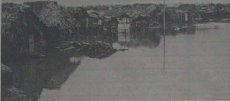
చాచి వలాలకు చెందిన దీర్ఘ వస్తువు తెలుగువారికి చెల్లారు మూలము దర్శనార్థం గురించి వెనుక ప్రాంతంలోని గురిపెలు