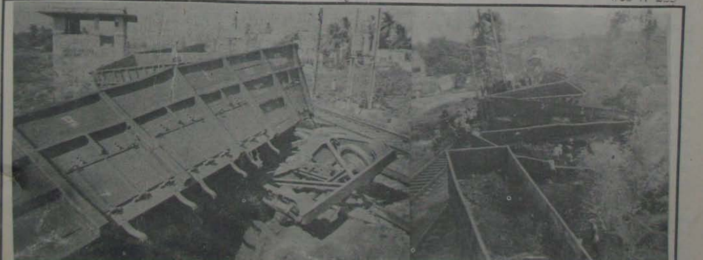
నెల్లూరు రైల్వే స్టేషన్ సమీపంలో 14వ తేదీ రాత్రి జరిగిన రైలు ప్రమాద విధ్వంస దృశ్యాలు - చెల్లాచెదిలిన పెట్టెలు; రైలు కట్ట క్రింద గుడిసెల వద్దకు ఎట్లా ఎగిరి పడ్డాయో చూడండవ! (వార్త 7 ఏకేలో)

జిల్లా రైతాంగానికి ఇంక పెద్ద ప్రమాదం ముంచుకొని వస్తుంటే, ఒక్క ఎమ్మెల్యే నేరు మెదపక పోవడం అన్యాయం. ఇద్దరు మంత్రిలు, ఎనిమిది మంది ఆఫీసర్ వరకే ఎమ్మెల్యేలు పుండి దండగ తున్నది. కృష్ణ గుంటూరు జిల్లాల రైతులు, వాయకులు ఈ విషయంలో ప్రదర్శిస్తున్న అందోళన పైతం నెల్లూరు రైతులలో, వాయకులలో వ్యక్తం కావడం లేదు. నిజానికి ఆ జిల్లాల రైతులు 11 ఏకేలో