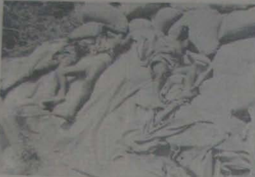
అక్కడనుంచి ముంబయికి వచ్చి లాల్ బొల్లవలన ప్రమాదంలో ప్రాణాలు కోల్పోయిన అపార్థిలు