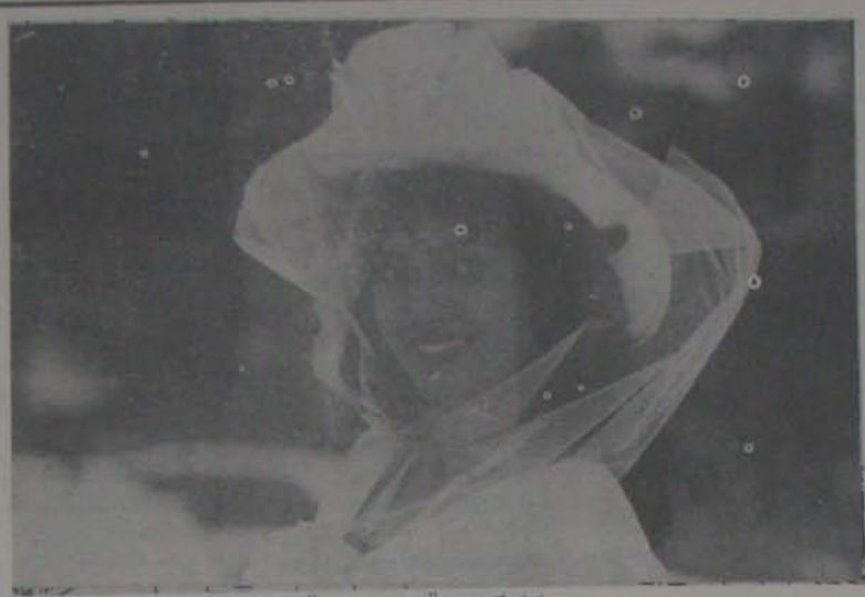
"వెన్నెలో అవకాశం" చిత్రంలో నువ్వు

అదేం జయప్రద తీర్చి వ్యవస్థలను రాజ్యసభలో పూలన్ దేవిని చూసింది ఇద్దరూ ఎం.పి.లీ వరకు ముగిసిన ఇద్దరూ కలువకొన్నాయి. వరస్థలకు వరదయం చేసుకున్నాడు. పూలన్ దేవిని వీరవారంగా జయప్రద తెగ పోగిసింది. జయప్రద అందరందలనూ పూలన్ దేవి చాలా మెచ్చుకుంటూ, "ఒక పాల్గొన్నట్లైతే వదిలించడానికి నాకు అవకాశం ఉంది." అంది. "అలాగే! కుంజాచ్యులేవన్నీ! మీరు ముఖానికి మేకప్ ఎలా చేసుకోవాలి? నాకోపాటు లాక్షి వస్తే వేర్వేరు." అంది జయప్రద. ఆ తర్వాత తన బలం చేసిన హోటల్ గదిలో పూలన్ దేవికి కొన్ని గంటల పాటు మేకప్ నేర్పించింది. "అదేది అందకాదు" అని మోలాటి అందకత్రయ వివాహించారు." అంది పూలన్ దేవి. "ఒకే!" అంది జయప్రద.