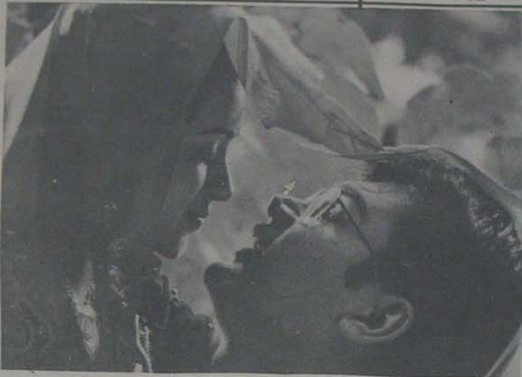
కళ్యాణప్రాప్తిరస్తు చిత్రంలో కావ్య వంశీ

తెలుగు చిత్రంలో మొట్టమొదటి సారిగా శ్రూర మృగం నటించిన తార ఎవరో తెలుసా? కన్యాంబ 1940 లో తయారైన “పండిక” చిత్రంలో అమె నిరుతువులతో నటించింది. ఆ పులికి నేరు కుట్టెన. హుడింగ్ జరిపాలను కున్నారా. “పాపం! దాని నేరు కుట్టెయింది. చాలా బాధ పడుతుంది. ఒక రెండు రోజులాగి హుడింగ్ను పెట్టుకోండి.” అని కన్యాంబ కోరింది. మరొకటి ఉదయం అమె ఆ పులి బోను దగ్గరికి వెళ్ళి స్వయంగా హుడింగ్ను అందించింది. ప్రశ్న రోజూ పులిని బోనులోంచి దియటకు తెప్పించి, మేక కారం 11 పెడితో