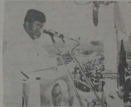
అత్మకూరులో జరిగిన బహిరంగసభలో ప్రసంగిస్తున్న ముఖ్యమంత్రి చంద్రబాబునాయుడు.