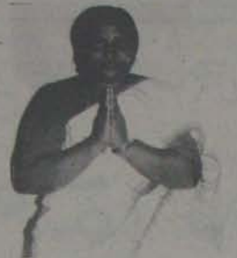
అదృష్టవంతురాలు! ప్రాంతాలలో అయితే ఓక్కరంపై ఒక్కరు తెలియదు. నాయకులూ లేరు. కార్యకర్త లనలే లేరు. ఎవరికి వుట్టిన లెదీవురా వెక్కి వెక్కి ఏర్పేవు

కారమంతా మోయాల్సి రావడంతో ఈ రుస్థితి ఏర్పడింది. అయిననూ కోపూరు, గూడూరులలో తప్ప కాంగ్రెస్ దారులు తెలియవు. సర్వేసర్టి, అన్నగూరు వంటి