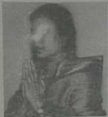
కన్పాపులర్ కావలిలో మహారథకు సుకరంగా ఫుంది. ఉదయగిరిలో కాంగ్రెస్ ఏర్పడి లోటును యానా రెడ్డి గారు ఫుండుస్తుంటే, కనిగిరిలో వచ్చే గోతను మహారథ రెడ్డి కిచ్చున్నాడు.

కావలి తర్వాత కాంగ్రెస్ కు అత్యధిక అధికత తెచ్చి పట్టె నియోజక వర్గం - కందుకూరు మాజీ ఎమ్మెల్యే కీ మహారథ రెడ్డి తన హక్కుగత ప్రతిష్టను పలుంగా పెట్టి ప్రధానం నిర్వహిస్తున్నాడు. అక్కడ తెలుగు ఎమ్మెల్యే