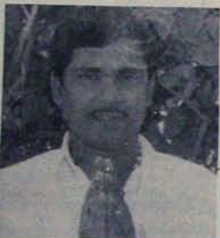
హరికృష్ణ కరుణేనేనే కలలు నెరవేరాయి!

విస్తరణ పుండవచ్చునని సైదరాబాదు రాజకీయ వర్గాల ఊహలు. అది తప్పక