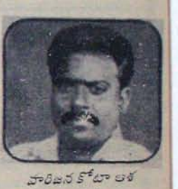
వారిజన కోడూ అక తీరేట్లు లేదు!