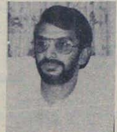
శత్రుత్వాలు కొని తెచ్చుకోవడం దేనికీ?