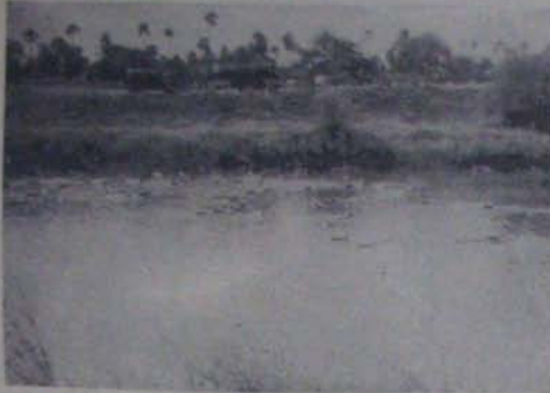
కాలువ కట్టలు క్రమి మట్టి తోలుకెళ్తున్న ట్రాక్టర్