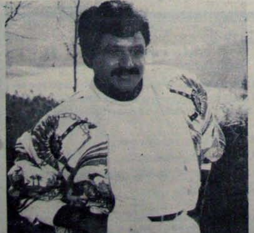
తండ్రి దుర్మతికి తానూ కారణమన్న మనోవేదన!

కొందరికి ఇచ్చగించడం లేదు; ఆయన ప్రాధాన్యం వీరికి కంటికి దూరం వుంది. ఎన్టీఆర్ కుమారులు బాలకృష్ణ, జయ శంకరకృష్ణ, జయకృష్ణలు ఇప్పుడు బాబుకు వ్యతిరేకంగా తయారైనారు.