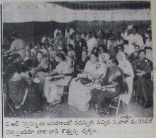
చి.ఆర్. పార్టీలు ఆచరణంలో సదస్సుకు వచ్చిన మహిళా మునిసిపల్ చేర్చుకుందరూ బాకీ భాసి కొత్తున్న దృశ్యం.

సభ్యత్వం అనం వివేకానంద రెడ్డి మాట్లాడుతూ మునిసిపల్ మంత్రిని