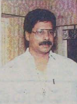
ఎత్తుగల చెక్కల కట్టకమి క్రింద రెడ కాపైక, పై కాంగ్రెస్ రంగుల