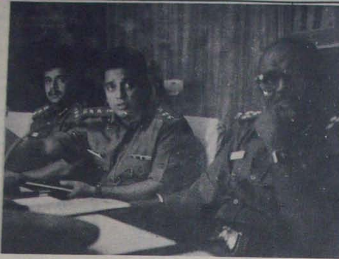
ద్రావిడ పార్టీలో ఎక్స్‌ప్రెస్, కమల్, అర్జున్