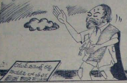
(నవంబరు 3వ తేదీ)

గాంధీ భుజ్జిత కేతమా భజి! వెనకంకోరిత నుశుమా భజి! సామ్యవాసం, రామకావ్యం సంభవించే కాలమా...!