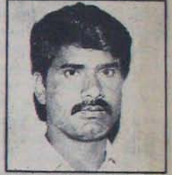
మంత్రి వివిధ పథకాలకు అందిన సొమ్ము, కేంద్రం నుంచి అందిన నిధులు సమన్వయ పారతి కర్మాచార్యుల పరికరాలతో కలిపి కార్యక్రమం

వ్యక్తుల విషయంలోనే దివాలా అనేది వారా తీసుకునే పరిస్థితి సామాజిక వెతికి గురయ్యే దౌర్భాగ్య దుస్థితి. ఆ దుర్భాగ్యత పరిణామం ఒక ప్రభుత్వానికి సంప్రాప్తమై తదనంతరం దుష్టాచారాలు ఎంత ప్రమాదకరంగా వుంటాయో ఘాటవడం కష్టం కానీ మహాభయకరం వహించిన ఆంధ్రప్రదేశ్ దొరతనం ఇప్పుడీ దౌర్భాగ్యాన్ని ఎదుర్కొంటున్నది.