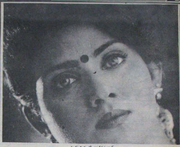
కిరణ్ చిత్రంలో వాళ్ళిక్కవార

"అటువంటి యువకుడు ఇంక పరకు మికు తారన సడలేదా?" తారనపడి పుంజి ఎప్పుడో నా చివరో తాలోట్టు పుండేది "మారింది పరకు కాంటి సినిమా రంగంలో నెంబర్ - 1 గా ఉన్నారు. సూర్యం ఆ స్థానాన్ని మధురీ దీక్షిపి ఆక్రమించు కుంటున్నారని మేలే ముందారు?" "మధురీ అందవందాలు గలది. చక్కని నటి. దాన్ని కూడా బాగా చేస్తుంది. అట్టే ఆమె నెంబర్ - 1 స్థానాన్ని ఆక్రమించు కుంటుంటుంది" అనలు ఆ నెంబర్ - 1 అనే స్థానాన్ని నమ్మించింది పుత్రికల రావు ఇటీవల నా చిత్రాలు కొన్ని బాగా అమ్మి పోయిన సమయం ఇదంతా అని మేలే ముందారు" అని దివంగు మూడు