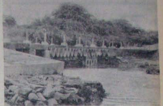
గూడూరు ఇబ్రాహీం రహదారి మృత్యు సేచి పని పొంది పున్న పంబలేరు వాగు

ప్రభుత్వం మారుమూల ప్రాంతాల్లో పంబలేరు వాగు పై గూడూరు వద్ద గల కాకేనే తలరాత మార్చే వాడుకపాటి కమిషన్లు. గత ఏడాది అక్టోబర్ 31 తేదీ ఈ కాకేనే పై ప్రయాణిస్తున్న టూరిస్టులను వాగులో పడిపోవడంతో 40 మంది ప్రాణాలు కోల్పోయారు. అప్పుడు తెలుగుదేశం అసెంబ్లీ అధ్యక్షుడు పోటీ చేస్తున్న సమయంలో దానిని సేవించే ఏర్పాట్లను అధ్యక్షుడు ప్రకటించాడు.