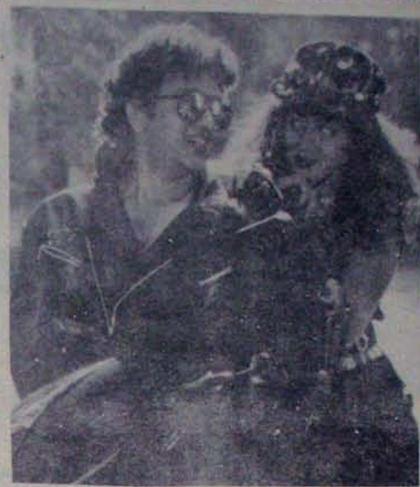
పెళ్ళి కుటుంబం గారి మద్రాసు చిత్రంలో చాలా మంది అమె