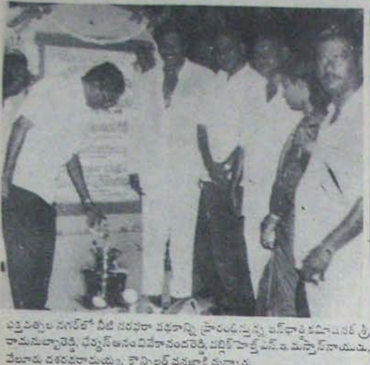
పరమపూజకాండీ దేవాలయ విభాగం ద్వారా వందనా కార్యక్రమం నిర్వహించబడింది. వందనా కార్యక్రమం చేపట్టారు.