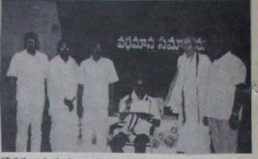
విజయం జయంత్యుత్సవం ముగించు సందర్భంగా జరిగిన కలబడి కొట్టుకున్నారు! వారిలో ఆంధ్రప్రదేశ్ కలం పాటలు వాద్యం చేసిన కళామండలి సభ్యులు కలం వీరులు కలబడి కొట్టుకున్నారు.

సభలో వుండి... గౌరవ మూలం ఎన్నికల అధికారిగా వ్యవహరించిన వ్యక్తి