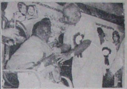
శ్రీలాలాద్ర నాటికావలను పురస్కరించుకొని నెల్లూరులో రంగస్థల నటులు రేబాల రమణను సన్మానిస్తున్న సినీ నటుడు జి.వి. సోమయాజులు