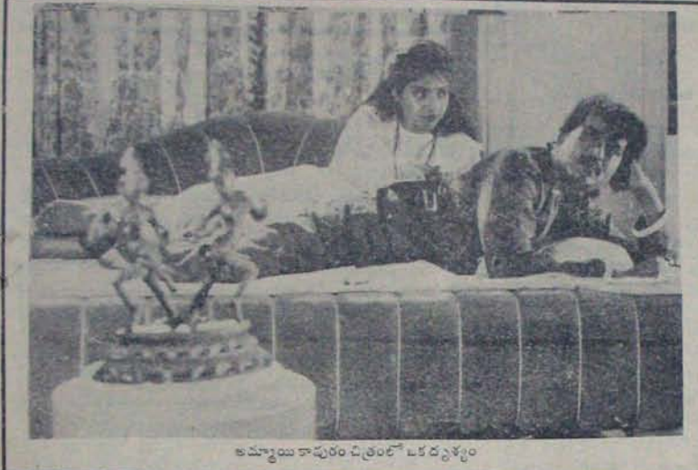
అమ్మాయి కాపురం చిత్రంలో ఒక దృశ్యం

జనవరిలో విడుదల కాబల్సిన చాలా చిత్రాలు వాయిదా పడ్డాయి. కొన్ని పూర్తి కాలింది. కొన్నిటికి దిజిటైజ్ కాలింది. “రాజంపా, లెడలాన్, కొండపల్లి రత్నయ్య గాకీపాదర్, లింగబాబు లక్ష్మీ, అబ్బాదా మలాకా, లీడర్, రైల్వే కూర్చో, అమ్మాయి, మార్కెట్టులు” ఈ చిత్రాలు జనవరిలోనే విడుదల చేయనున్నట్లు ప్రకటించారు. ఒకటి రెండు చిత్రాలకు మాత్రం కొనుగోలు దారులు ఉన్నారు