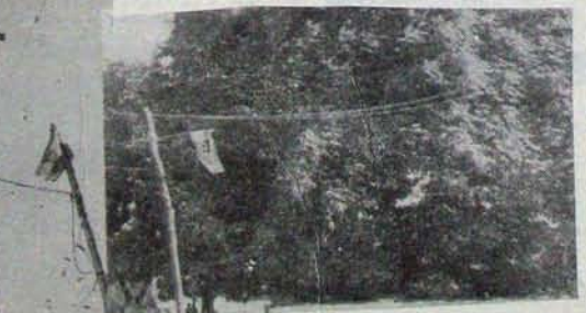
టైట్లర్ల దగ్గర, పోలీసు పెరకే గ్రాండ్లో కరెంట్ తిగలు లాగి లైట్లు వెలిగించిన దృశ్యం

టైట్లర్ స్వాగతార్పాటం కోసం టౌన్లో ఆరు కోటి మిల్లార్ల ప్రాజెక్టును అలంకరించిన విద్యుద్దీప తోరణాలకు వట్టికొక కరెంట్ స్తంభాల నుంచి వైద్యు లాగి కరెంట్ వాడుతున్నాడు. కాటో ఖర్చు లేదనే మలకన భావంతో కాటోలు పగలు కూడా వెలుగుతున్నా పున్నాయని! ఎంత దండగ? అడిగి డైరెక్టర్లం అధికారకు ఎక్కడుంది?