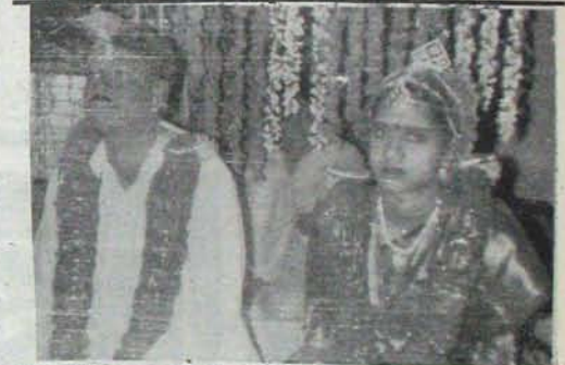
వెల్లూరు లోని 'సీఎంబీ' అధికారికంగా అభ్యర్థులకు ట్యూట్లు పంపించి కుంటున్నా వారిని

నిలంధన పెట్టింది. ట్యూట్లుకు ముందు 'అభ్యర్థులు' అందరూ ఇచ్చుకుంటున్నారు. ట్యూట్లు సమయంలో వేలం పాటలో ఎవరూ ఎక్కువ పెట్టే పార్టీకి వారితో ట్యూట్లు