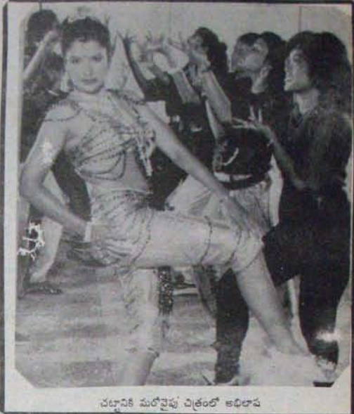
నటనానికి మరోవైపు చిత్రంలో అభిలాష

ఇలా 'ప్రెస్మీడ్' లో దర్శక నిర్మాతలు గొప్పలుచెప్పుడం మామూలు. గతంలో మోహన్బాబు విడుదలకు ముందు తన ప్రతి చిత్రం గురించి ఇలాగే ప్రకటించేవారు. ఏవరికి ఆయనే తగ్గి, కొన్ని ప్రేక్షకులకు నచ్చలేదు. అందుకోక నుంచి నేను నడిచే ఏ చిత్రానికీ కూడా ముందే హట్ అవుతుందని ప్రకటించే దలను కోలేదు" అన్నారు- ఎం.ఎ. కొంప 10, పేజీలో