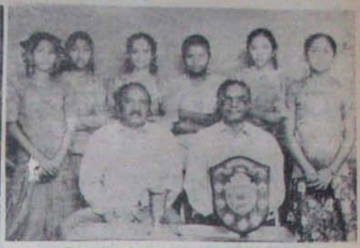
జిల్లా కో-ఆపరేటివ్ కమిటీలో కార్యకర్తలతో మొదటి బహుమతి స్వీకారం. కుటుంబ సంక్షేమ నిర్మాణాలకు సహకారం పొందేందుకు కమిటీ సభ్యులు సహజంగా వచ్చారు.

ఎవ్విగారి మాటకు విలువ లేదు రాఫూరు నియోజకవర్గం