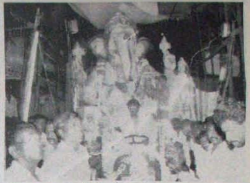
చిన్నబంకు కోసం గూడూరులో పంతుం! విజయవాడలో కంట్రీ క్లబ్ లో వుంటే ఫస్ట్ క్లాస్ అర్జంట్ లోన కావచ్చింది. తెన్నలో నిమజ్జనానికి త్రవ్వకం చేయవచ్చు అనుభవం దొరుకుతుంది.

నక్కలైట్ లో ఏమిటి నరరూపరాక్షసత్వం? అంటే... కంట్రీ క్లబ్ లో 10 కేరీ రాజ్ 8 గంటల ప్రాంతంలో నక్కలైట్లు పూజలుగా పాఠ్యం చేశారు. 4వ బాస్ పోలీసు స్టేషన్ లో పాఠిక గజాల దూరంలో, మాటి ఏపి శ్రీ రామమూర్తి అంది ఎదురుగా మిస్టర్ మార్ సుబ్రహ్మణ్యం నాయుడు ఆఫీసు వుంది. ఆ రాజ్ నాయుడు ఆఫీసులో వని చూశానని, క్రిందకు దిగి, ప్రాంతంలో వైపు నడచి వస్తుంది నాశనం. కామాక్షి స్ట్రీట్ వెనుకగా వున్న చిన్న కారీ స్టలంలో ఇరుగురు నక్కలైట్లు నక్కలైట్లు వుండి నారలు, నాయుడు పదరుగులు ముందుకు నడిచి రాగానే, వీరిలో ముగ్గురు ఆయనకు ఎదురు వెళ్లి, దగ్గరగా నిలచి, కణక పై కుప్పాకి ఆనంది కార్యాలి. వారెవరో, ఏమి జరుగుతున్నారో తెలుసు కునేలోగానే నాయుడు క్రిందకు వారి పోయాడట. తులోగా అందికు ఆనంది మర రెండు బుల్లిలు పంపారు. అప్పారణ నాయుడు ప్రాణం పోయినట్లుంది. కానీ అనుమానం తీరక క్రింద పడిన కవాన్ని కారీలో తప్పి చూసి, వీపు పైన కత్తిలో నాలుగు పోట్లు