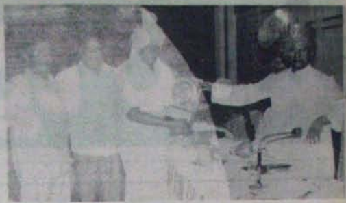
వారిను ప్రాంతంలో మాత్రమే రెడ్డి గారు కార్యక్రమం ఎంచుకుని కార్యక్రమం అందజేస్తున్న రెడ్డి గారు ఆయన ముఖ్యమంత్రి కార్యక్రమాలను ప్రకటిస్తున్న ప్యానెల్ లో రెడ్డి గారు సభించారు.

అతని ముందు నియమం కట్టి పోయి కాలిపోయి పైకెత్తే ముఖ్యమంత్రి అయిన రెడ్డి గారు నిరూపణ కాలేదు. అందువల్ల తమ ప్రయోగాల్లో ఎవరూ రాజకీయ వివరాల కోరిక పోలేదు. ఏదీ ఆకాశానెత్తి పాల్గొని నెట్టించమని గోర సరి చెప్పకున్నారు. జనం తోడం మాత్రం భావించి జరిగింది. ఎన్నికలకు దారిని, బిస్మిల్లు, ప్రాజెక్టు, ఎదురు ఎంపికల సమావేశం, రాజ్యాలు, వెంటకాగి, బిచ్చరెడ్డి పాఠం, అల్లూరు, పున్నపల్లి, నెల్లూరు లోని ప్రాంతాలలో పోయి, అంగీకారం మించి సూచనలు జరిపి తరలింపక వచ్చారు. అయితే సభ పైన, ప్రసంగాల పైన అసెంబ్లీలో కాక, అలవంతుగా రిఫ్యూస్ బిచ్చరెడ్డి గారు ప్రాంతంలో నియంత్రణ పోయింది. అటు నుంచి లోక దిగడం అటునుంచి ఎన్నికల: 40, 50 వేల మందిని సమావేశించి సమీపికి ఈ రాకపోకల బిచ్చ గ్రాంట్ నింపలేదు. నెట్టి కనీసముగా సుందరానికి పైబట్టి వెళ్లి