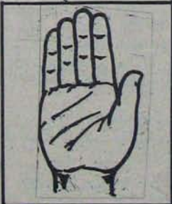
కాంగ్రెస్ను గెల్పించాలి. సగటు రైతు గౌరవం మిగతాలంటే

సమగ్రాభివృద్ధికి నివిని గెల్పించాలి. దేశం సమగ్రతకు