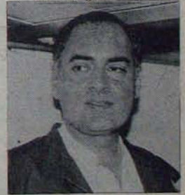
మరీ మరీ కోరుతున్నారా- చేతి గుర్తుకు ఓటేయమని! V. శ్రీనివాసులురెడ్డి.