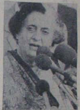
కావల నిందేముంది? అందుకే మల్లీ మల్లీ

కాంగ్రెస్ గెలవాలి, గడచిన బద్దెళ్లలో ఎంతో అభివృద్ధి వేయించుకొన్నారా రానున్న బద్దెళ్లలో అంతకంత అభివృద్ధి సాధించు కొందాం! ఓట్లకోసం ఎందరెందరో వస్తారు- కాని నివివలె సేవ చేసేవారు దొరకరు; కోట్లు కోట్లు కుమ్మరిస్తారు - కాని నివి వలె సమస్యలు తెలిసిన