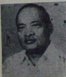
అంత చనువుగా అభ్యర్థిస్తున్నాడు!

నివిపై కత్తికట్టి కాంగ్రెస్పై కక్షజూని ఓడించేస్తామని వీరంగాలాడుతున్నారు. నివి చేసిన పాపమేమిటి - పేదలకు సేవ చేయడమా? నివి చేసిన నేరమేమిటి- పెద్దల్లో కొలువు కొలవననడమా? ఎవరో కొందరు వద్దంటేనే ప్రజా సేవకుడు