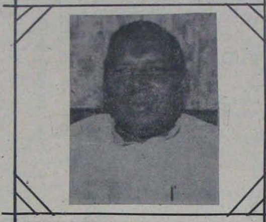
మనుమలను పురుగుల్లా విడిచేవారు

చనువు మనకుంటుంది, ప్రజా ప్రతినిధుల నుంచి అంతకంటే మించి