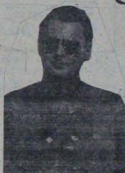
వేరే వ్యాపకం లేదు వేరే వ్యాపారం లేదు