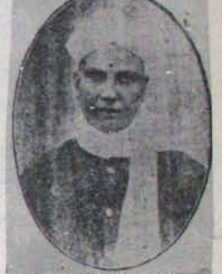
వావిళ్ల వెంకటేశ్వర శాస్త్రిలు

వైకృత పురాణాలను వావిళ్ల వారు వెలుగులోకి తెచ్చారు అనమంది. నిరదనవేలు గారల క్రిమి భారత వ్యాఖ్యానాన్ని కూడా పరి ముద్రించారు. ప్రబంధాలన్నింటికీ పేరికలు వ్రాయించారు. భారత, భాగవత రామాయణాలలోని ముఖ్య ఘట్టాలకు టిక్కెలు వ్రాసి ప్రత్యేక గ్రంథాలుగా ప్రకటించారు. విజయ