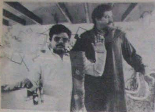
రాజీ ఎంఎల్ఎల్ కాన్స్ట్రక్టు కర్మ