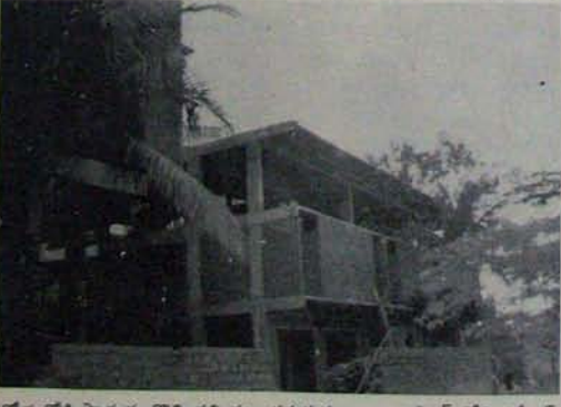
కోర్టులోకి పోయిన కొన్ని వచ్చినట్లు కడుతున్న బంజారాహిల్స్ లోని ఎన్టీఆర్ వివాదాస్పద భవనం

రామారావుకు నోటీసు ఇచ్చింది. అయితే ఈ మొత్తం చాలా ఎక్కువగా వుందని. దీంట్లో కొంత తగ్గించాలని రామారావు కార్పొరేషనుకు కోరాడు. దానిమీద నలభై చేలు తగ్గించి