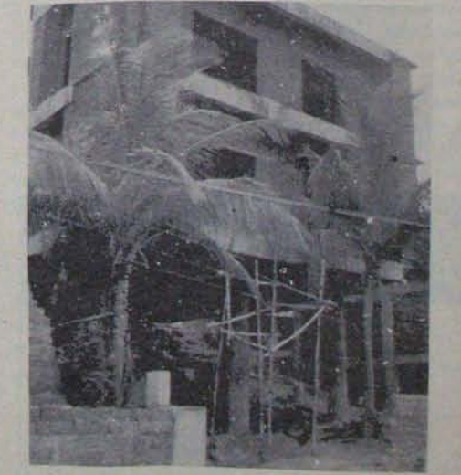
ప్లాన్ అప్రూవల్ కారుండానే అంతస్తు మీద అంతస్తుగా శరవేగంతో లేచి పోతున్నది.

చందాలు దండి కట్టడోతున్న ఇంటి ప్లాన్ అప్రూవల్ కోసం 'మూగ చెవిటి వారి ఆశ్రమం' అనే దొంగపేరు పెట్టి పన్ను ఎగ్గొట్టేందుకు ముఖ్యమంత్రి కాళ్లు పట్టుకొని ఇల్లు కూలకుండా కోర్టునాశ్రయించి ఎన్టీరామారావు పరమ నీచంగా ప్రవర్తిస్తున్నాడు!