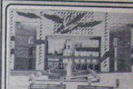
ఇండో అమెరికన్ ట్రేడ్ ఫేర్ వారి కార్యకర్త