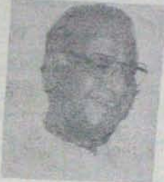
ప్రతం చెడినా ఫలం చిక్కేనా?

నెల్లూరు మంత్రి ఎం.కె. కాలాగి అకో ఎదురు చూస్తున్న కృష్ణాపట్నం తీర్మాన విద్యుక్త కేంద్రం ఆధారిత విచారణ అధిలో విజయవంతం. పైచేటి రంగంలో నెలకొల్పబడి వెయ్యి మేగా వాట్ల విద్యుత్ కేంద్రం పెండ్లి అప్పగించలే అవకతవకలు అధికారుల మంత్రి మంతరి సమావేశంలో సాక్షాత్తు మంత్రిల ముఖ్యమంత్రి పై ర్యాలేషన్లతో ఈ విషయం రద్దీకొంది. "కృష్ణాపట్నం" పెండ్లి కోర్టుకోసం రద్దీకొంది సమాధి సుందరి, ముందు జాగ్రత్తగా