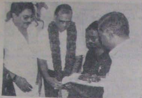
మోరం సార్వజనీన యాజమాన్యం, తమ పోయాం మిష్ట్రై ప్రాంతాధిపతి రజితమ్మ దివ్యాం, మాన్ ప్రైవేట్ రిట్యూ కర్మిష్ట్రైస్ ద్వారా ఆర్డర్లు పంపించి వికల రాష్ట్రం, ఆంధ్ర ప్రదేశ్ లోని రెడ్డి, సోయాం యాజమాన్య సోదరులు సంతోషం కాస్త ప్రకటించారు.