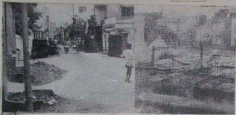
సుబేదారుపేటలో చాలావరగా వ్యాపకాలు పుట్టిన వస్తున్న పైలట్ రిజిమెంట్ ప్యాకెట్ల పాక