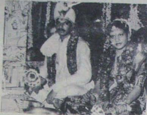
నెల్లూరులో పెంచు పంది రాక్షసు. జి. కొండారెడ్డి తనయు మమక; రాక్షస ప్రసాదార్థి దిడిఎస్. ఎండిఎస్. వీరి వివాహం 10తది కళాశ్రీతలో జరిగింది.